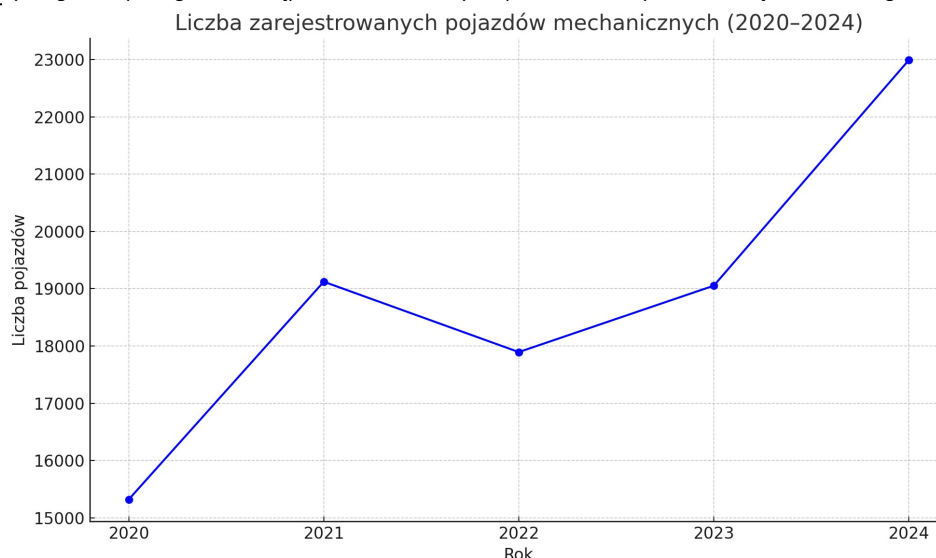
Ilustracja 2: Liczba zarejestrowanych pojazdów mechanicznych w powiecie gdańskim w latach 2020-2024