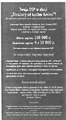
Do_Zarzadu_OSP.png ~136 kB