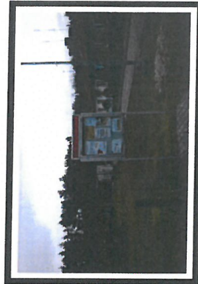
Lokalna tablica ogłoszeń

SOLECKA STRATEGIA ROZWOJU dla sołectwa Powiż Osiedle w gminie Powiż wypracowana przez GOW na warsztatach w ramach programu UMW - „Wielkopolska Odnowa Wsi 2013-2020”