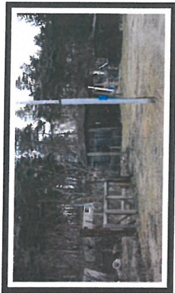
Zaniedbana część osiedla