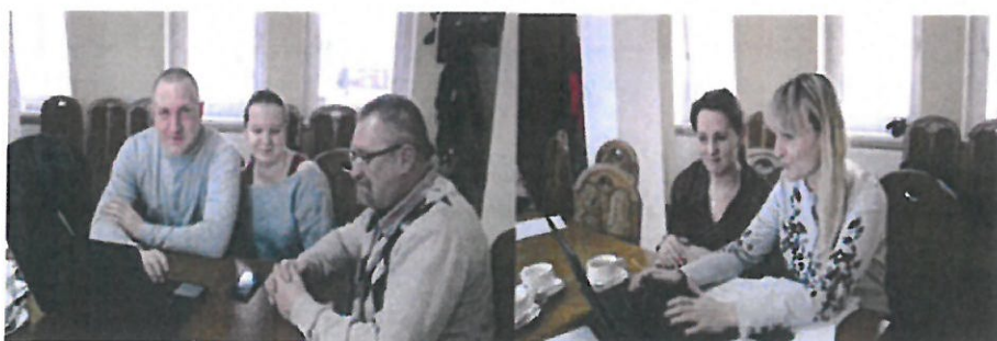
Warsztaty z budowania Sołeckiej Strategii Rozwoju Wsi 31.01 – 01.02. 2020 r.