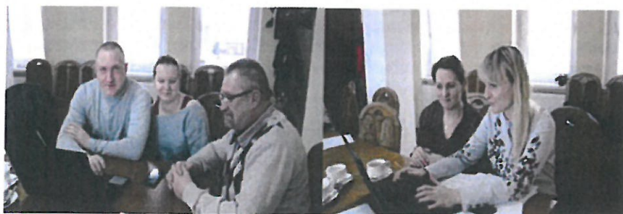
Warsztaty z budowania Sołeckiej Strategii Rozwoju Wsi 31.01 – 01.02. 2020 r.