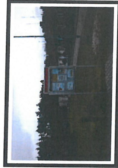
Lokalna tablica ogłoszeń

SOLECKA STRATEGIA ROZWOJU dla sołectwa Powiśle w gminie Powiśle wypracowana przez GOW na warsztatach w ramach programu UMWW - „Wielkopolska Odnowa Wsi 2013-2020”