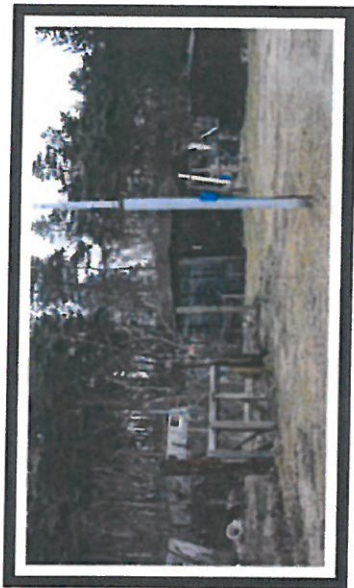
Zaniedbana część osiedla