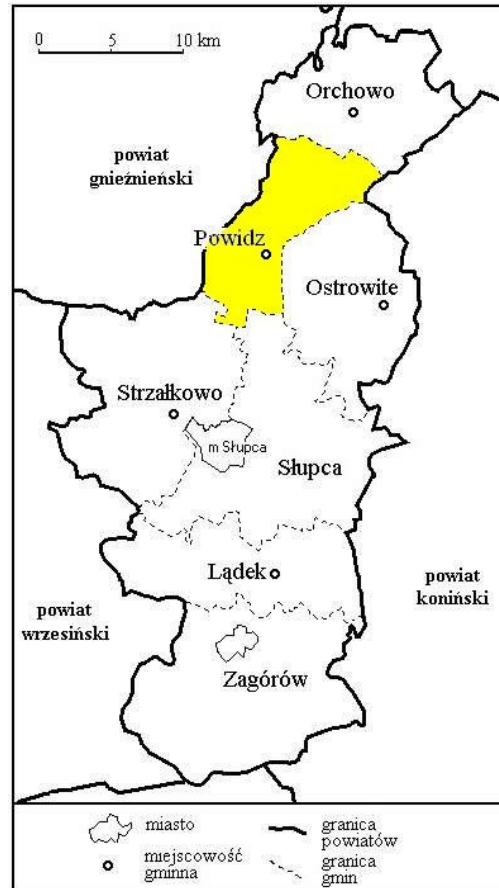
Położenie Powidza na mapie powiatu (rys.2)

Graniczy z czterema gminami powiatu słupeckiego: