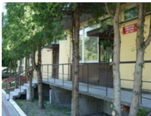
Biblioteka w Powidzu (rys.7)

Czasopisma udostępniane są również na zewnątrz.