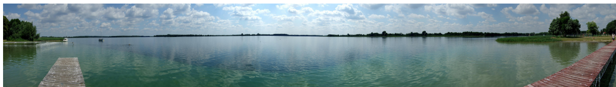
Jeziro Powidzkie (rys.1)

Gmina Powidz, jedna z najmniejszych gmin w byłym województwie konińskim zajmuje powierzchnię 80 km 2 . Jest atrakcyjnie położona między największymi jeziorami, tj. Jeziorem Powidzkim i Jeziorem Niedziegieł.