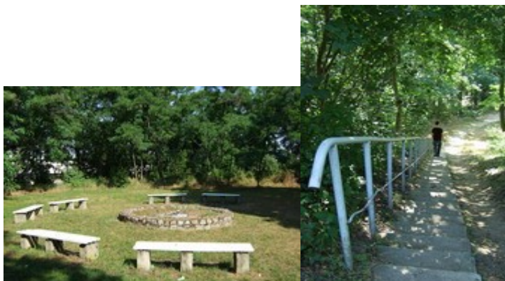
Góra zamkowa (rys.10,11)

twierdzą, że Góra Zamkowa zapada się. Jeżeli proces ten ma rzeczywiście miejsce, to można by przypuszczać, że znajdują się pod nim lochy zamkowe.