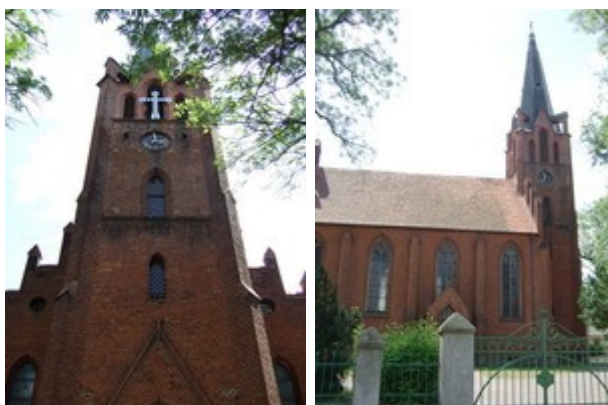
Kościół pw. Św. Mikołaja (rys.8,9)