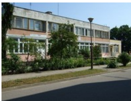
Zakład Opieki Zdrowotnej w Powidzu (rys.5)

Dla mieszkańców Powidza podstawowa opieka zdrowotna jest realizowana przez Zakład Podstawowej Opieki Zdrowotnej w Powidzu. Jest to Niepubliczny Zakład Opieki Zdrowotnej (prywatny), świadczący usługi w ramach umowy z NFZ bezpłatnie dla ubezpieczonych.