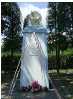
Figura Ducha Świętego (rys.12)

Rzekomo jedna z czterech w Europie. Przypuszczalnie została ona wystawiona w miejscu, gdzie w 1779r. stał przytułek dla starszych ludzi pod wezwaniem Ducha Świętego. Zniszczona w czasie drugiej wojny światowej, stanęła ponownie dzięki staraniom pracowników powidzkiego Tartaku.