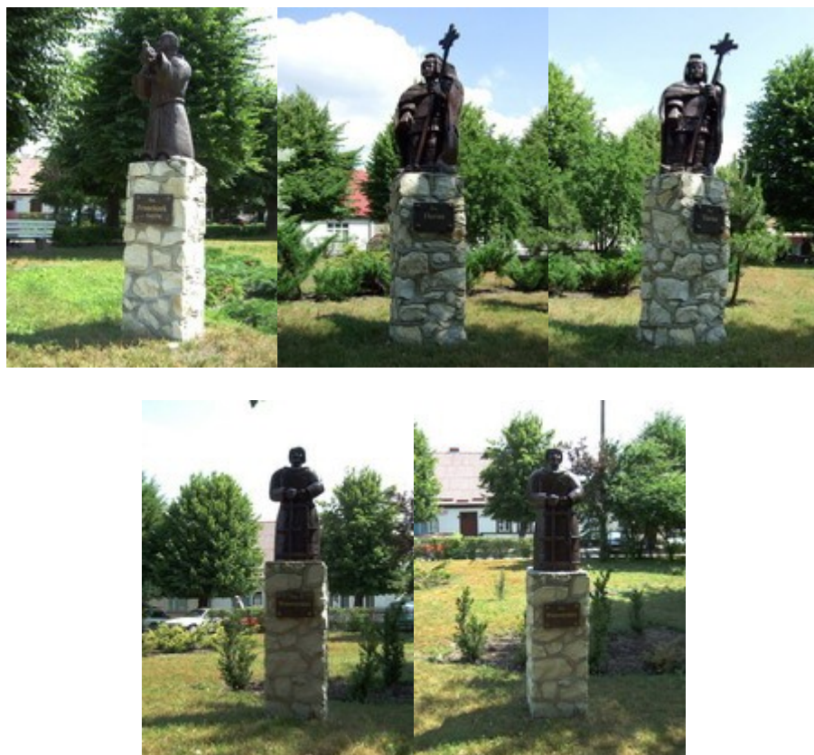
Rzeźbione figury na rynku w Powidzu (rys. 15,16,17,18,19,20,21,22)