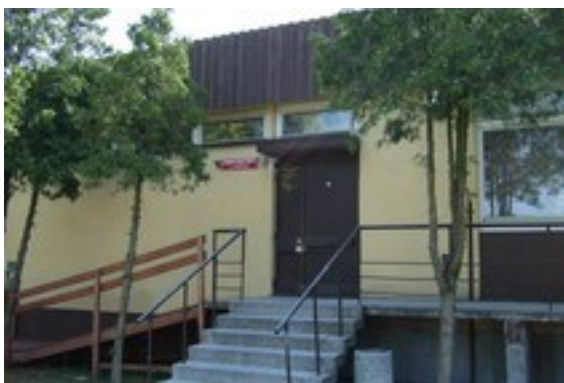
Dom Kultury w Powidzu (rys.6 )

Planowana jest modernizacja istniejącej bazy i rozbudowa obiektu z uwzględnieniem środków unijnych.