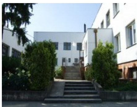
Zespół Szkolno-Przedszkolny w Powidzu (rys.3)

Na terenie gminy Powidz funkcjonuje jedna placówka edukacyjna – Zespół Szkolno-Przedszkolny, w którego skład wchodzi: gimnazjum, szkoła podstawowa oraz przedszkole. W ZSP zatrudnionych jest 24 nauczycieli oraz 12 pracowników obsługi i administracji.