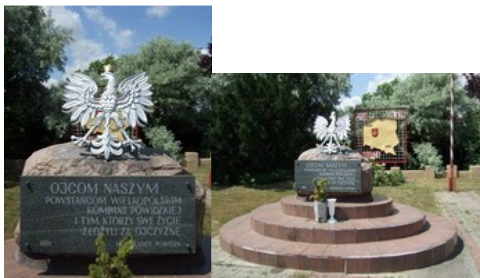
Pomnik Powstańców Wielkopolskich (rys.13,14)