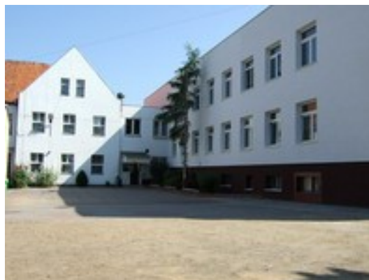
Widok od strony boiska (rys.4)