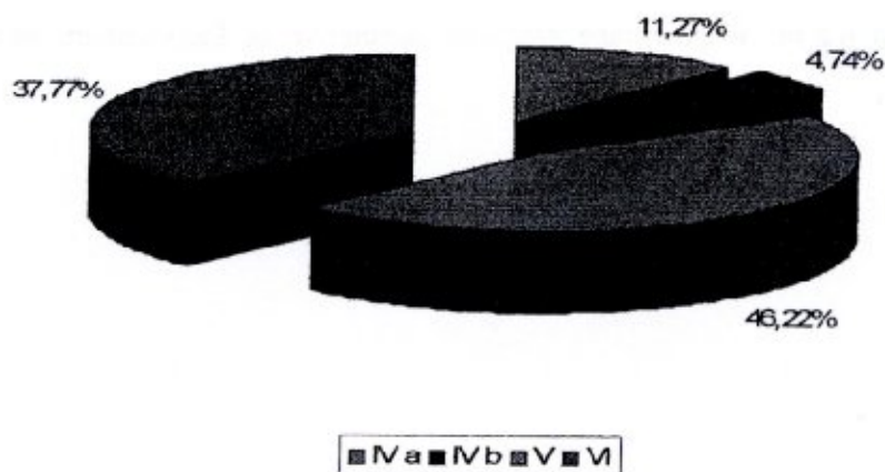
Wykres 2. Klasy bonitacyjne gruntów ornych w solectwie Wylatkowo