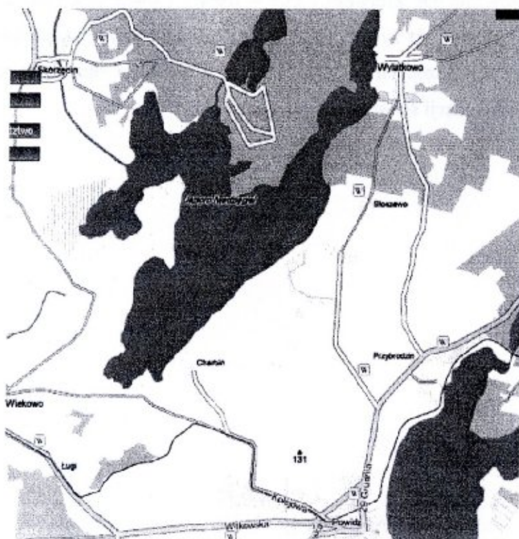
Rysunek 1. Położenie Sołectwa Wylatkowo

Wieś położona jest w odległości ok. 6 km na północny wschód od Powidza w obrębie Powidzkiego Parku Krajobrazowego, formalnie powołanego Rozporządzeniem Wojewody konińskiego z 1998 roku i jest jednym z 10 wyodrębnionych w podziale administracyjnym gminy sołectw gminy Powidz. Powierzchnia Wylatkowa jest równa ca powierzchni 1660 ha.