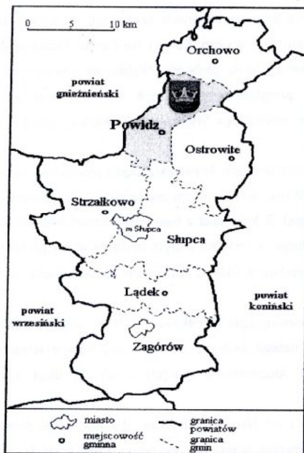
Rysunek 2. Położenie gminy Powidz w powiecie słupeckim.