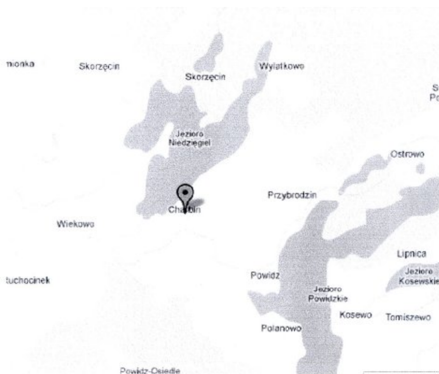
Rysunek 1. Położenie Sołectwa Charbin.

Wieś Charbin położona jest w gminie Powidz, na terenie powiatu słupeckiego, w województwie wielkopolskim. Wieś położona jest w odległości ok. 4 km od Powidza w obrębie Powidzkiego Parku Krajobrazowego, formalnie powołanego Rozporządzeniem Wojewody konińskiego z 1998 roku i jest jednym z 10 wyodrębnionych w podziale administracyjnym gminy sołectw gminy Powidz.