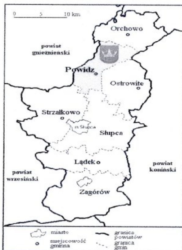
Rysunek 2. Położenie gminy Powidz w powiecie słupeckim