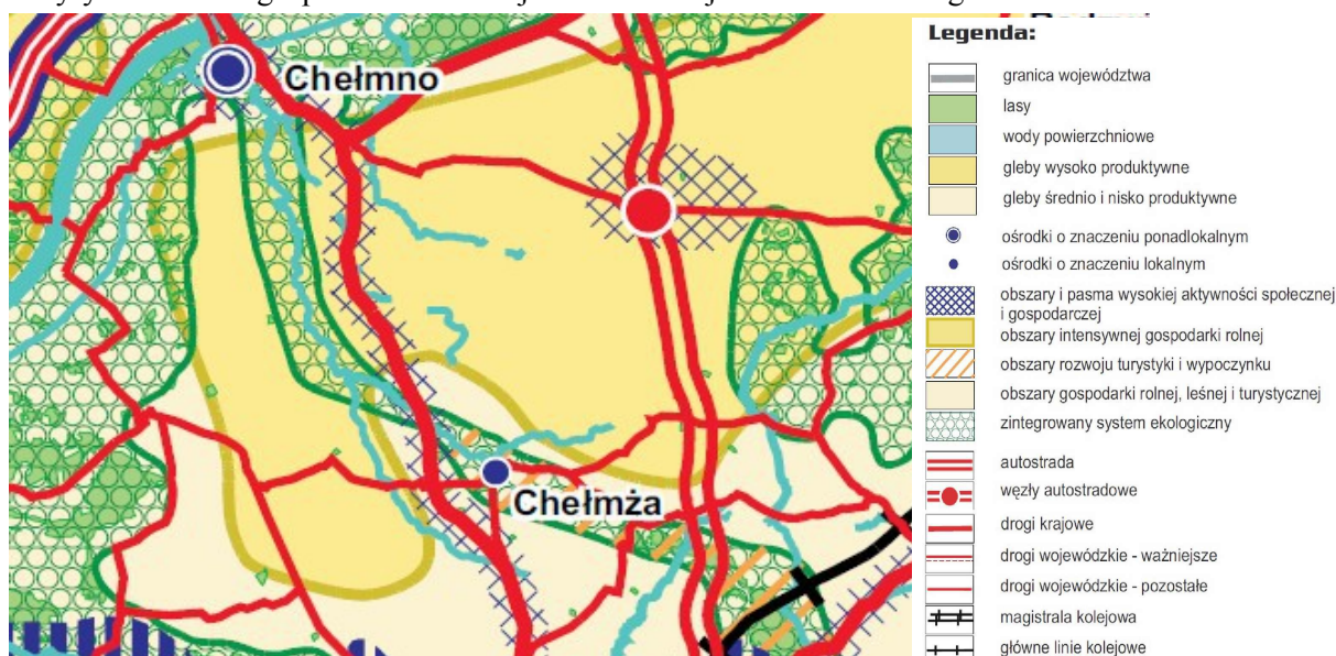
Rys.3. Wyrys z Planu Zagospodarowania Województwa Kujawsko-Pomorskiego