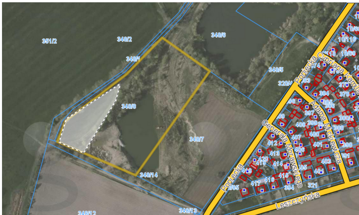
Część dz. nr 348/8 w Pudliszkach