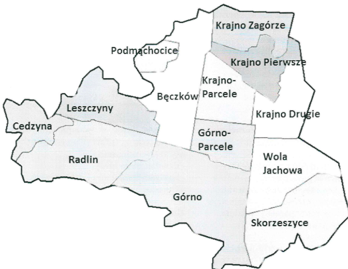
Rysunek 1 Podział gminy Górnio na sołectwa