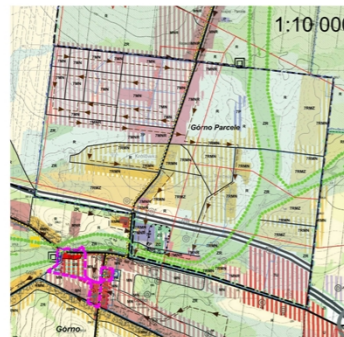
WYRYS ZE STUDIUM UWARUNKOWAŃ I KIERUNKÓW ZAGOSPODAROWANIA PRZESTRZENNEGO GMINY GÓRNO

Projekt planu sporządzono na kopiach mapy przyjętej do zasobów Powiatowego Ośrodka Dokumentacji Geodezyjnej i Kartograficznej Starostwa Powiatowego w Kielcach (nr licencji GN-III.6642.4251.2015_2604_P)