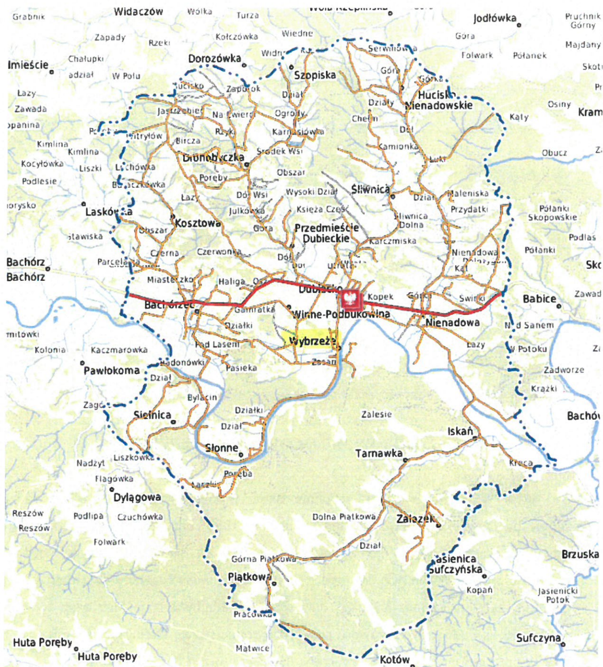
Rys.1 Obszar Gminy Dubiecko

Miejscowość Wybrzeże jest jednym z 17 sołectw tworzących Miasto i Gminę Dubiecko. Powierzchnia wsi zajmuje ok. 801,56 ha. Zamieszkuje ją 339 mieszkańców.