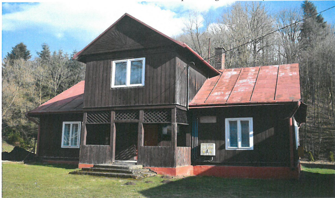
Budynek byłej biblioteki, obecna świetlica