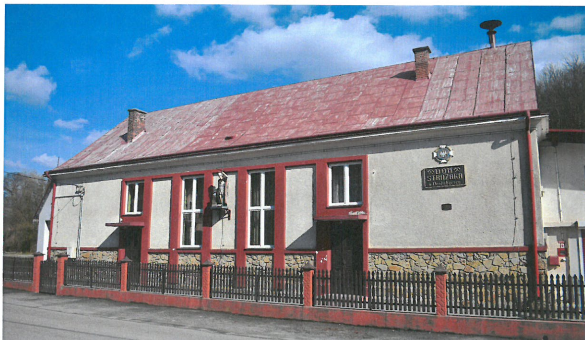
Budynek remizy OSP