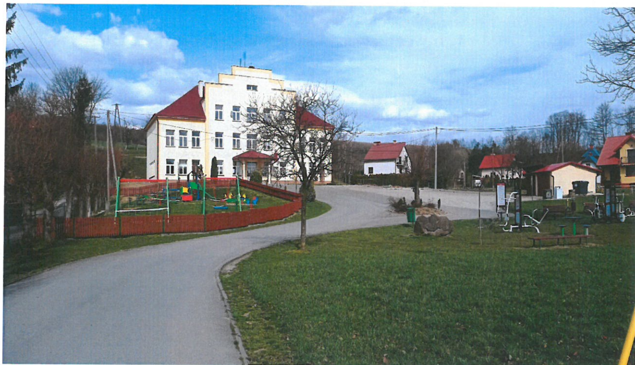
Fot. 4 Budynek Zespołu Szkół w Przedmieściu Dubieckim

Drugim ważnym obiektem jest budynek Zespołu Szkół w Przedmieściu Dubieckim. W skład Zespołu Szkół wchodzi: Publiczna Szkoła Podstawowa w Przedmieściu Dubieckim, Filia Publicznej Szkoły Podstawowej w Przedmieściu Dubieckim z siedzibą w Drohobycze, Samorządowe Przedszkole w Przedmieściu Dubieckim. Odbywają się w nim uroczystości dla mieszkańców o charakterze państwowym, kulturalnym i społecznym. Byli i obecni uczniowie biorą aktywny udział w życiu społecznym na terenie wsi.