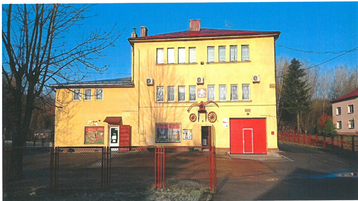
Fot. 3 Budynek remizy OSP w Przedmieściu Dubieckim

Ważnym obiektem w miejscowości Przedmieście Dubieckie jest budynek remizy Ochotniczej Straży Pożarnej, wykorzystywany do celów społecznych i kulturalnych. Odbywają się w nim zebrania wiejskie oraz zebrania OSP. Obiekt ten służy dla potrzeb lokalnej społeczności.