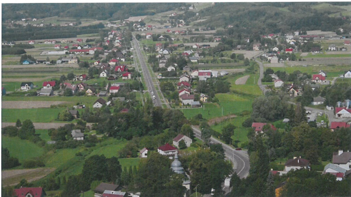
Fot.2. Przedmieście Dubieckie z lotu ptaka

Wykaz poszczególnych sołectw wchodzących w skład Miasta i Gminy Dubiecko przedstawia poniższa mapa: