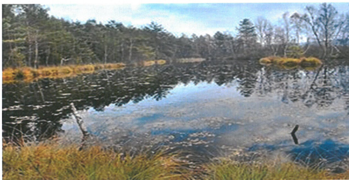
Fot. 5.

W dużej ilości gatunków reprezentowana jest flora mszaków, które mają szczególne znaczenie w budowie torfowiska. Bogato reprezentowana jest gromada gadów. Występują tutaj jaszczurka zwinka, jaszczurka Żyworodna, padalec, zaskroniec, żmija zygzakowata. Przedstawicielami płazów są ropucha szara, żaba wodna, żaba moczarowa. Bogate występowanie owadów, których samych chrząszczy jest 700 gatunków, sprzyja gnieźdzeniu się ptaków, znajdujących tu obfite pożywienie. Występują bażanty, kuropatwy, strumieniówki, pokrzewki, pierwiosnek i piecuszek. Ponadto spotyka się kokoszki wodne, dziwonie, kaczki krzyżówki, a w okresie ptasich wędrówek cyranekę i cyraneczkę.