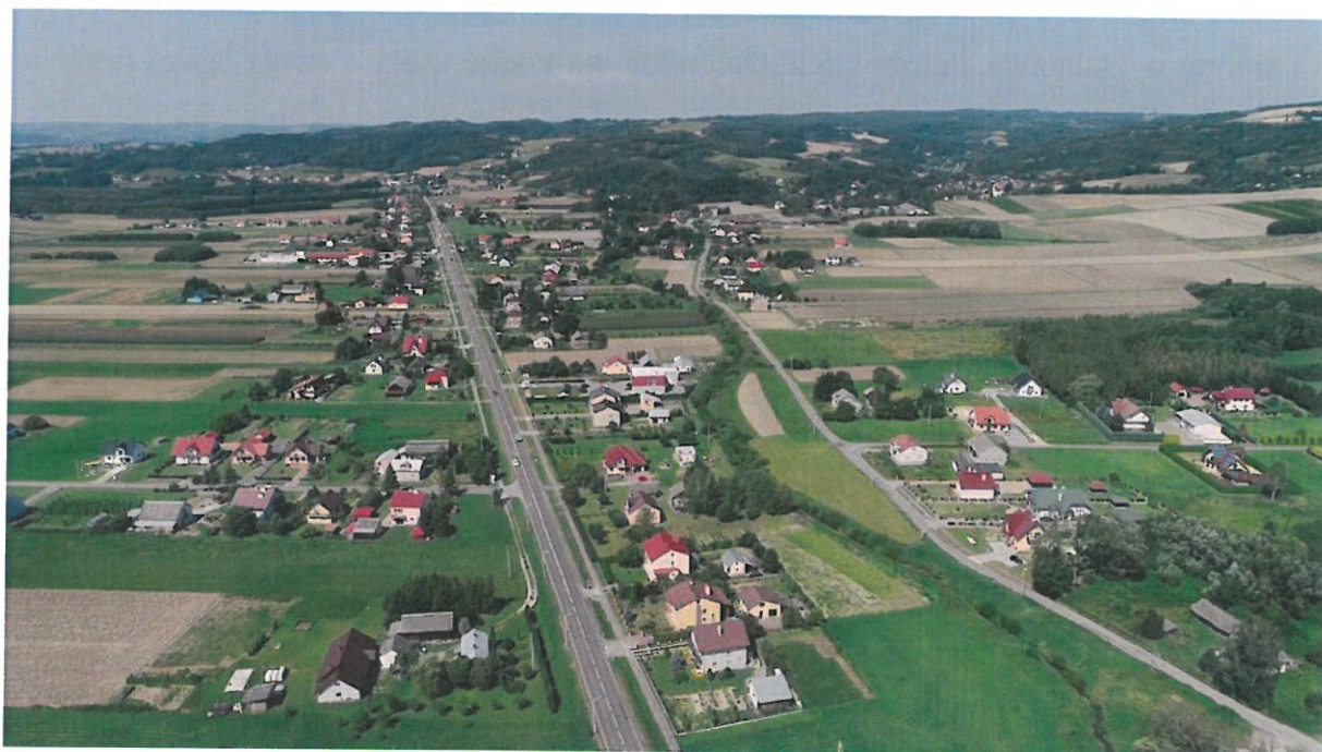
Fot.1. Przedmieście Dubieckie z lotu ptaka

Miejscowość Przedmieście Dubieckie położona jest we wschodniej części województwa podkarpackiego, w powiecie przemyskim. Od północy sąsiaduje z Drohobyczką, od zachodu z Kosztową, , od południa z Wybrzeżem i Bachórcem, a od wschodu graniczy z Śliwnicą i miastem Dubiecko. W skład miejscowości wchodzi przysiółki o specyficznych nazwach jak: Błonie, Czerwonka, Czobot, Dół, Dział, Góra, Haliga, Osz, Potoczniówka, Zadział. Przedmieście Dubieckie jest jedną z siedemnastu miejscowości wchodzących w skład Miasta i Gminy Dubiecko. Pod względem ludności miejscowość znajduje się na drugim miejscu po Nienadowej.