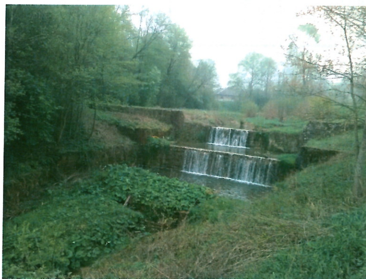
Krajobraz wsi- kaskada wodna

Budynek po byłej szkole podstawowej mieszczący świetlicę wiejską. Teren wokół budynku do zagospodarowania w infrastrukturę społeczną (obecnie tylko huśtawka i dwa bujaki).