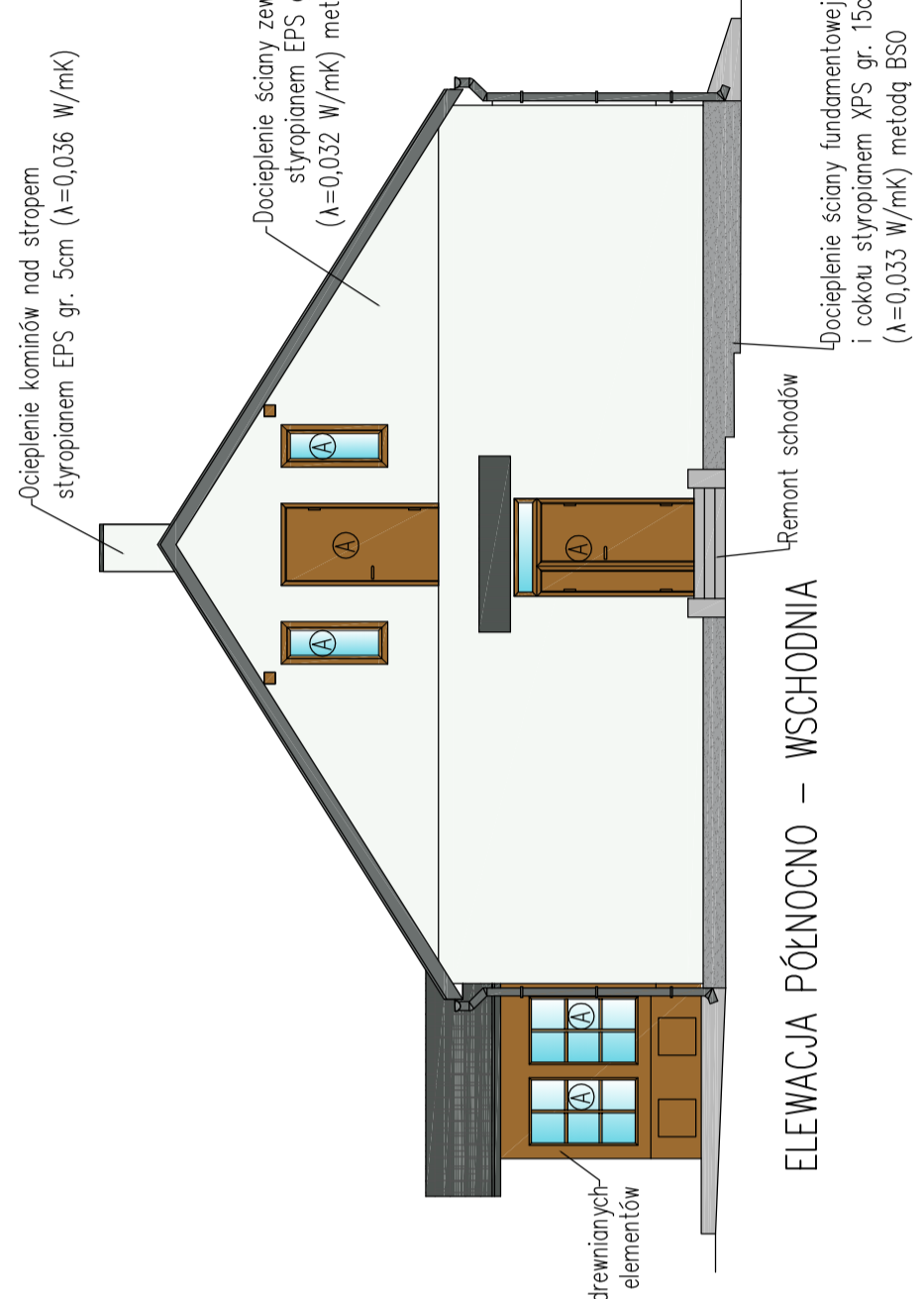
ELEWACJA POŁUDNIOWO – WSCHODNIA