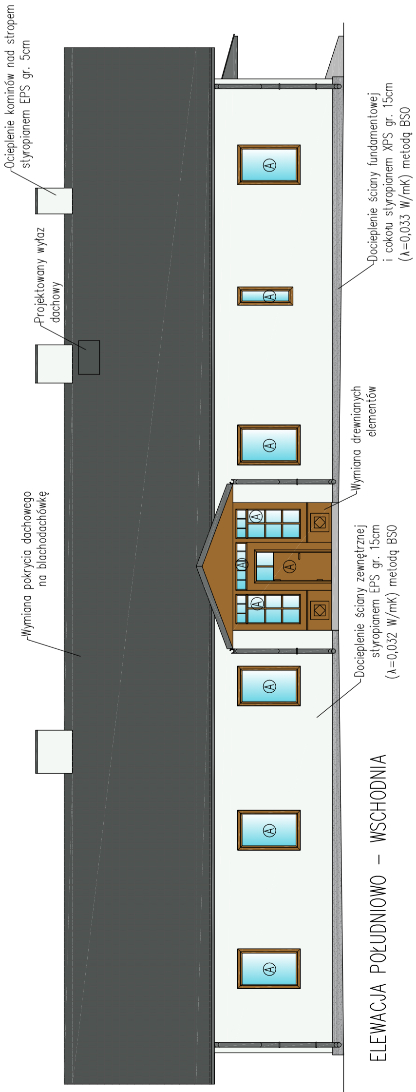
ELEWACJA PÓŁNOCNO – ZACHODNIA