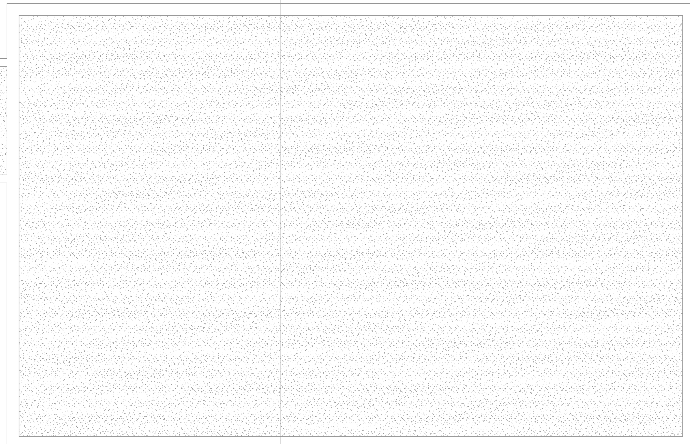
Zestawienie pomieszczeń piwnicy