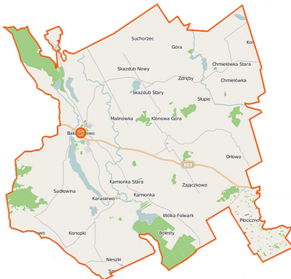
RYSUNEK NR 1 Mapa gminy Bakałarzewo.

Gmina Bakałarzewo leży w północno-wschodniej części Polski w województwie podlaskim. Od północy graniczy z gminą Filipów, od wschodu z gminą Suwałki, od południa z gminą Raczki, natomiast od zachodu – z gminą Olecko (województwo warmińsko-mazurskie).