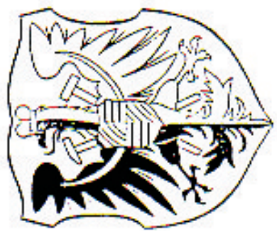
GMINA ZŁOTY STOK ZAL. MAPOWY DO STATUTU GMINY