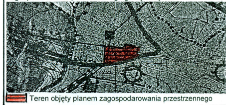
Kopia studium uwarunkowań i kierunków zagospodarowania przestrzennego gminy Złoty Stok