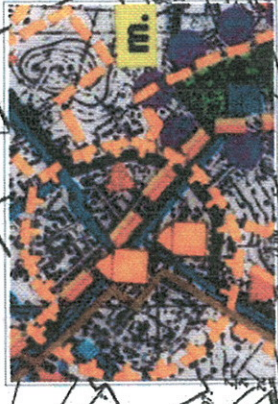
Wzrys ze "Studium..." granicza opracowania

Ze zmianą: UCHWAŁA nr XXXVIII/263/2006 Rady Miejskiej w Ziębicach z dnia 17 marca 2006 r