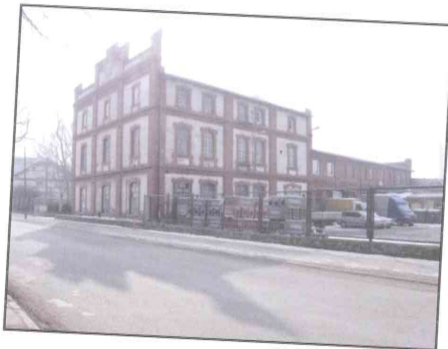
ul. Kolejowa 35