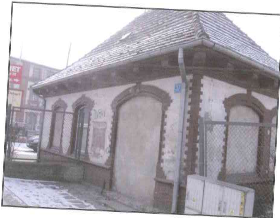
ul. Kolejowa 37