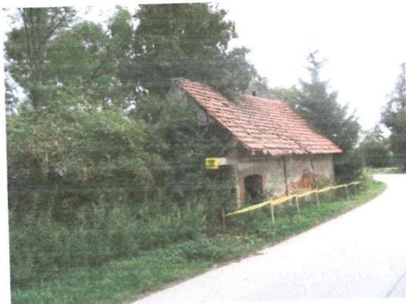
Fot. Nr 1,2: elewacja frontowa, widok ogólny od strony drogi.