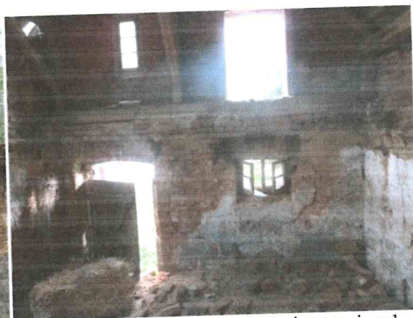
Fot.3,4: Elewacja wschodnia wejścia od podwórza do pom. nr 1 i nr 4, widok od strony pomieszczenia nr1.