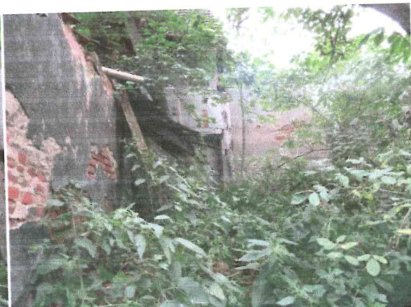
Fot. 5,6: Elewacja tylna, ruiny dachu nad pom. nr 4, ruiny pom. nr3.