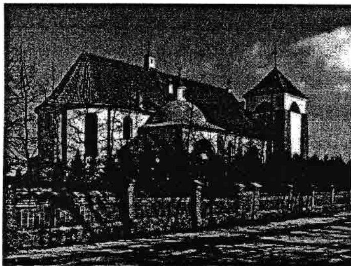
Kościół parafialny pod wezwaniem św. Małgorzaty

Zatory są największą oraz najliczniej zamieszkałą wsią w Gminie Zatory. Posiadają zaplecze instytucji administracyjnych, oświatowych, handlowych i usługowych.