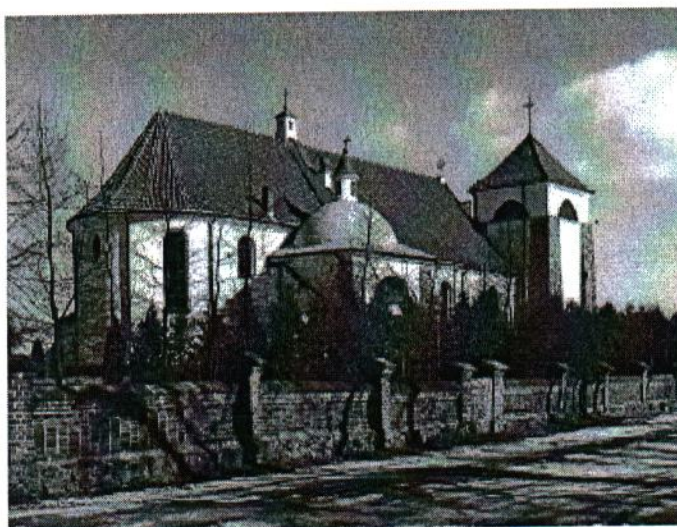
Kościół parafialny pod wezwaniem św. Małgorzaty

Zatory są największą oraz najliczniej zamieszkałą wsią w Gminie Zatory. Posiadają zaplecze instytucji administracyjnych, oświatowych, handlowych i usługowych.