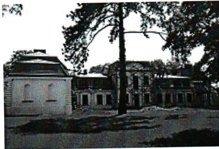
Pałac – widok z ogrodu