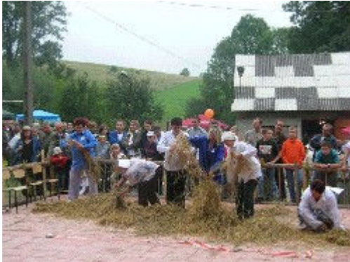
Wybory Baby i Chłopa – 2007r.