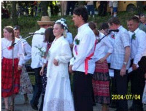
Wesele w przedwojennej Bażanówce- 2004r.