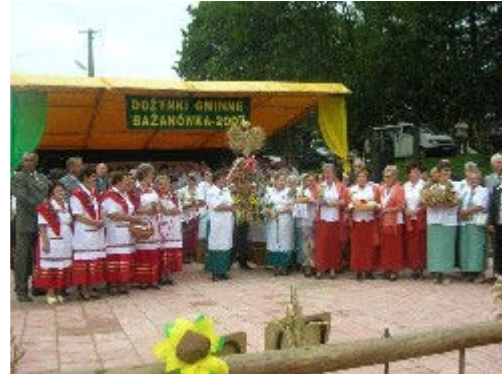
Dożynki gminne- Bażanówka 2007r.