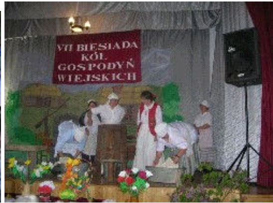
Obrzęd prania – maj 2007r.