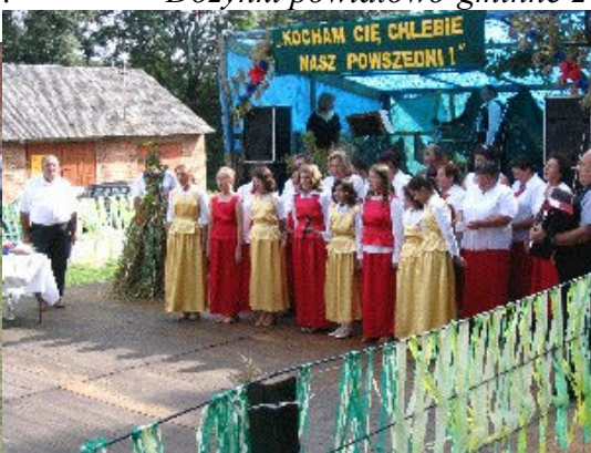
Baby i Chłopa Gminy Zarszyn -2005r