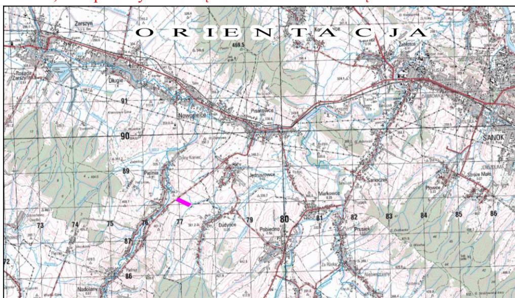
LOKALIZACJA OBSZARU ZMIANY STUDIUM

Według podziału Kondrackiego na regiony fizycznogeograficzne omawiany obszar położony jest w obrębie mezoregionu Pogórze Bukowskie o krajobrazie porozcinanej przez rzeki pogórskiej wyżyny. Jednostka ta zlokalizowana jest na terenie Zewnętrznych Karpat Zachodnich makroregionu Pogórze Środkowobeskidzkie. Pogórze Bukowskie rozpościera się pomiędzy doliną rzeki Jasiołki na zachodzie a dolinami rzek Sanu i Osławy na wschodzie. Od południa graniczy z Beskidem Niskim i Bieszczadami Zachodnimi oraz Górami Sanocko – Turczańskimi, a od północy z Kotliną Jasielsko – Krośnieńską.