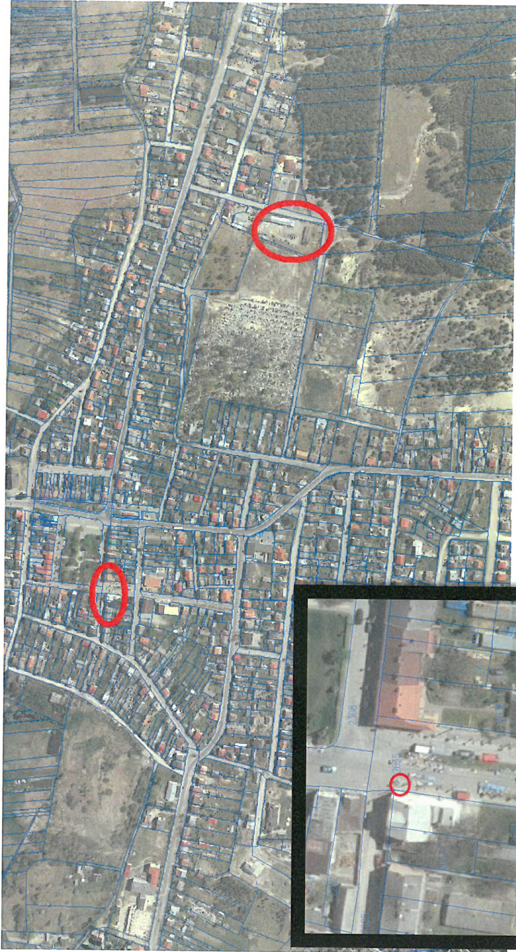
Załącznik 2a – Część I / VI / VII