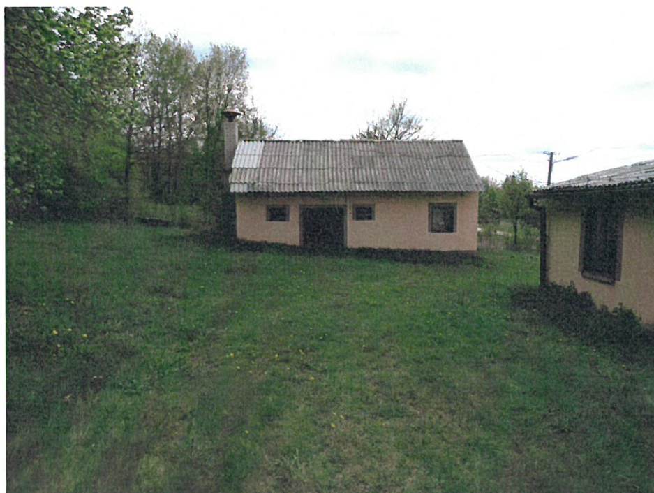
Budynek garażu OSP.