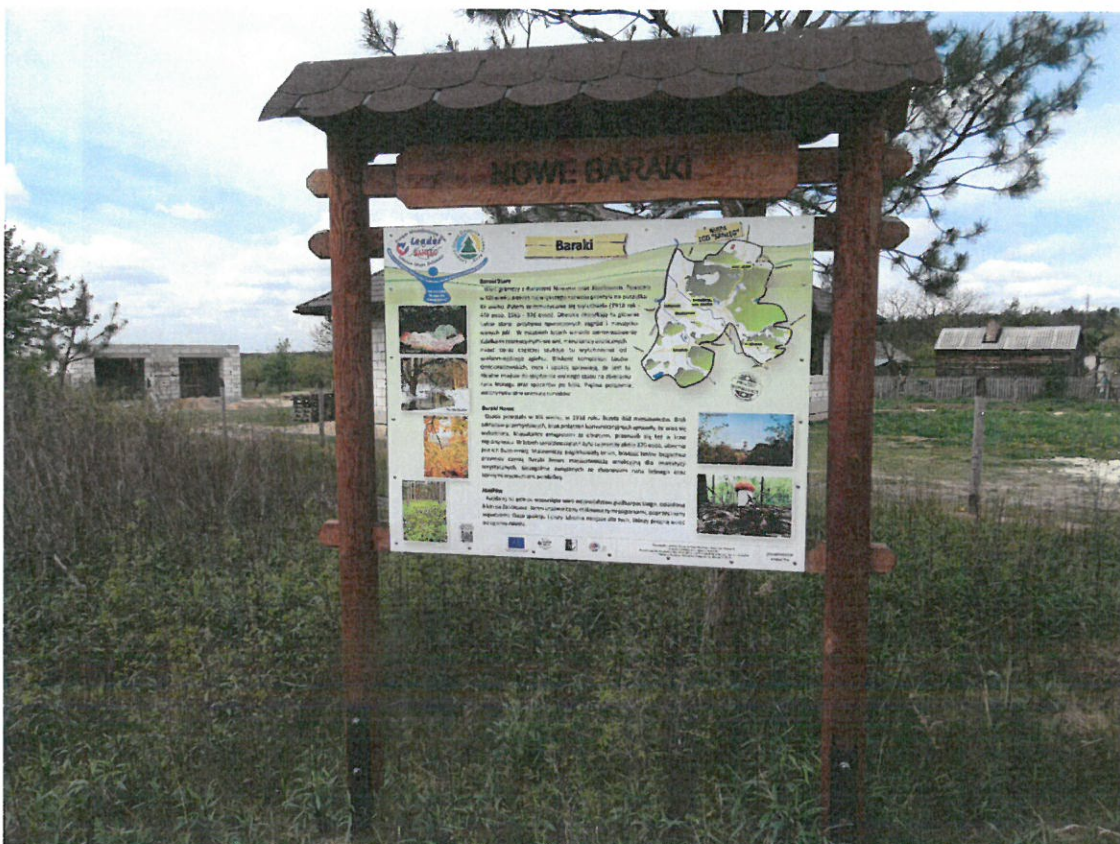
Tablica informacyjna na granicy sołectw Stare i Nowe Baraki.