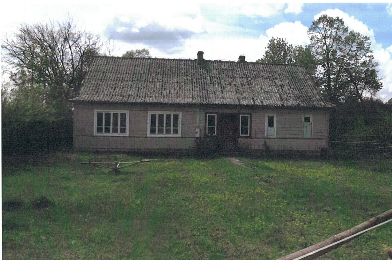
Budynek po starej szkole w Starych Barakach.