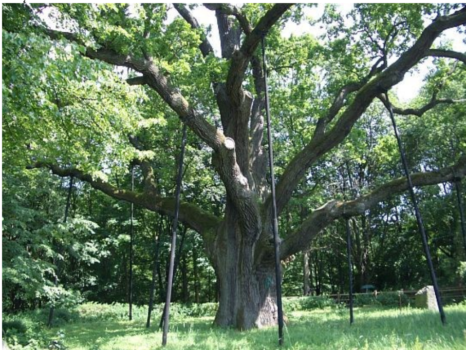
Rys. Nr 6. Dąb Bartek

Pierwsze naukowe badania Bartka i sporządzenie jego metryki miało miejsce w 1860r. W 1829r. dąb miał 14 konarów głównych i 16 bocznych. Obecnie posiada 8 konarów głównych. Dąb ulega próchnieniu i w każdej chwili może nie wytrzymać swojego ciężaru i naporu wiatrów. Wymaga on stałej pielęgnacji i konserwacji. W 1905r. pożar sąsiednich budynków spowodował martwicę, która pociągnęła za sobą odpadanie kory. Miejsca te pokryto więc korą z innych ściętych dębów. W latach 1920, 1953, 1978, 1991 przeprowadzono zabiegi konserwatorskie mające na celu zabezpieczenie drzewa.