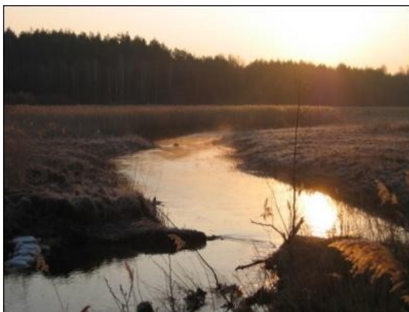
Rys. Nr 4. Rezerwat Przyrody „Górna Krasna”

Najistotniejszym i jednocześnie najcenniejszym przyrodniczo elementem krajobrazu doliny Krasnej są występujące tu duże powierzchnie dobrze wykształconych zbiorowisk roślinnych: wodnych, szuwarowych, torfowiskowych, łąkowych i leśnych. W obrębie rezerwatu stwierdzono łącznie 48 zbiorowisk i zespołów roślinnych, wśród których 17 należy do siedlisk przyrodniczych podlegających ochronie. Zbiorowiska tworzą 343