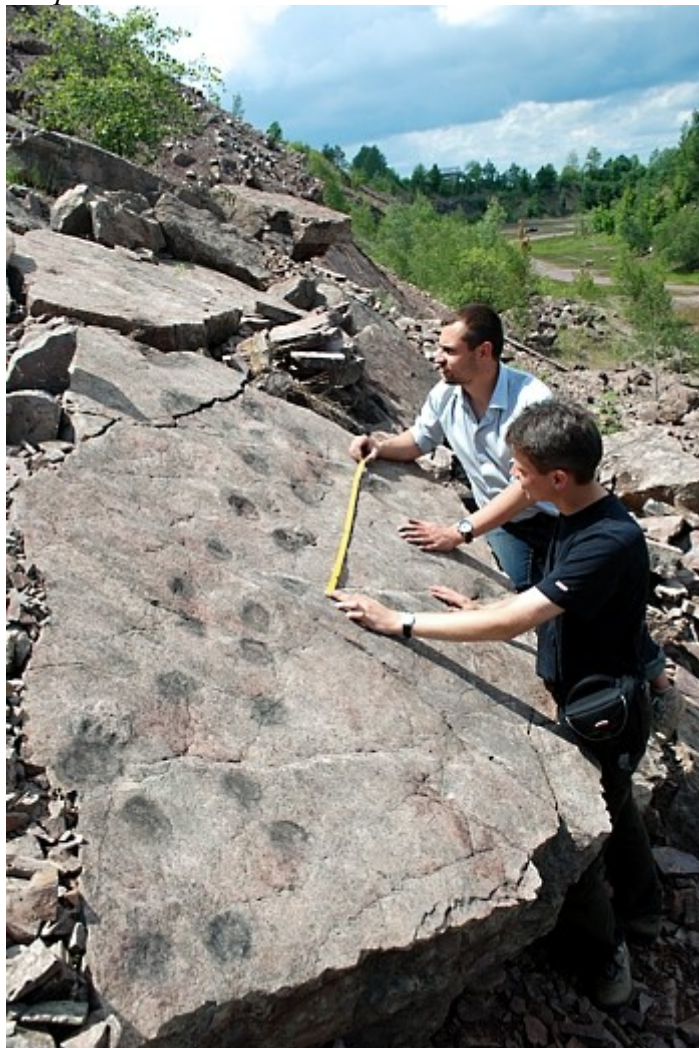
Rys. Nr 5. Tropy tetrapoda

Plan Ochrony Rezerwatu Przyrody „ZACHEŁMIE” na okres od 01.01.2012 do 31.12.2031r. zakłada następujące cele ochrony: