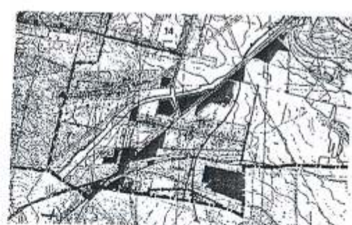
Wycisk ze Studium uwarunkowań i kierunków zagospodarowania przestrzennego gminy Zagnańsk