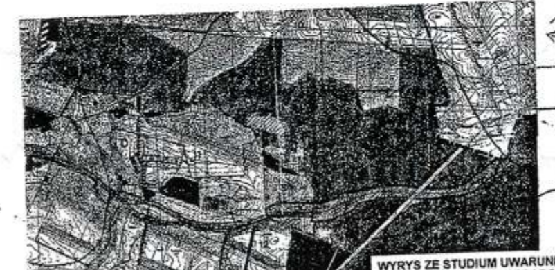
WYKRES ZE STUDIUM UMARUDKOWANIA I KIERUNKÓW ZAGOSPODAROWANIA PRZESTRZENNEGO GMINY ZAGNAŃSK