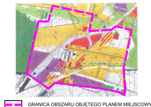
WYRYS ZE STUDIUM UWARUNKÓW I KIERUNKÓW ZAGOSPODAROWANIA PRZESTRZENNEGO GMINY ZAGNAŃSK skala 1:10 000