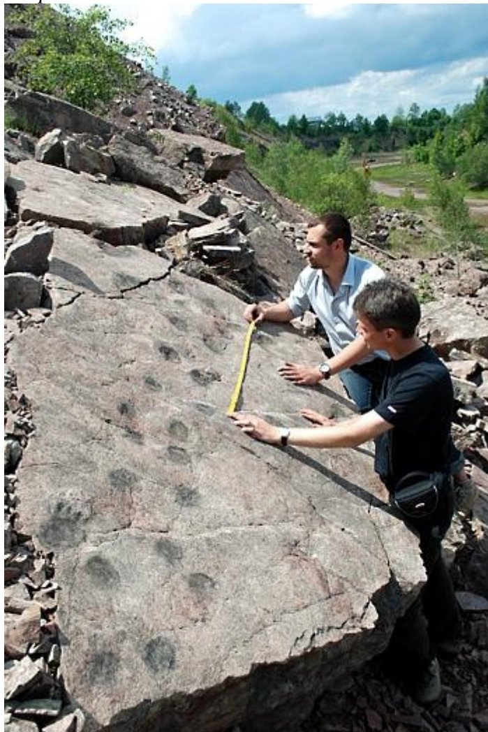
Rys. Nr 5. Tropy tetrapoda

Plan Ochrony Rezerwatu Przyrody „ZACHEŁMIE” na okres od 01.01.2012 do 31.12.2031r. zakłada następujące cele ochrony: