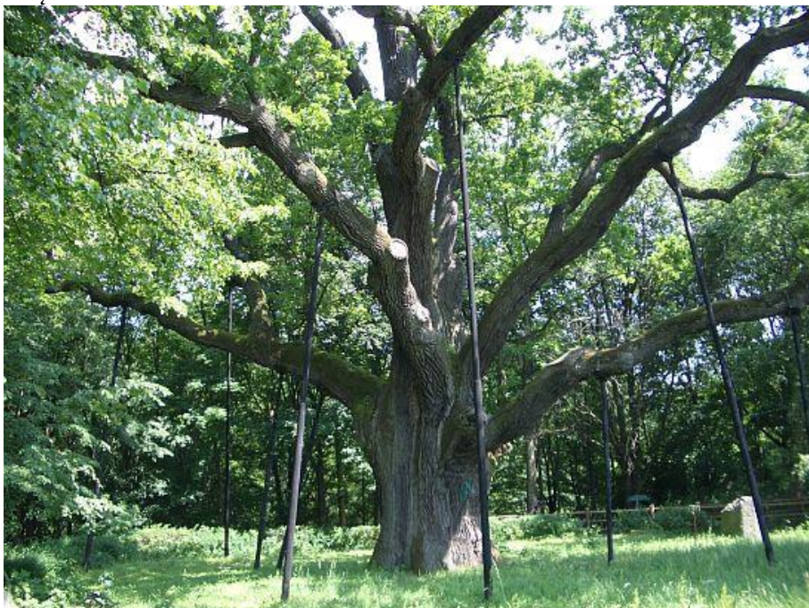
Rys. Nr 6. Dąb Bartek

Pierwsze naukowe badania Bartka i sporządzenie jego metryki miało miejsce w 1860r. W 1829r. dąb miał 14 konarów głównych i 16 bocznych. Obecnie posiada 8 konarów głównych. Dąb ulega próchnieniu i w każdej chwili może nie wytrzymać swojego ciężaru i naporu wiatrów. Wymaga on stałej pielęgnacji i konserwacji. W 1905r. pożar sąsiednich budynków spowodował martwicę, która pociągnęła za sobą odpadanie kory. Miejsca te pokryto więc korą z innych ściętych dębów. W latach 1920, 1953, 1978, 1991 przeprowadzono zabiegi konserwatorskie mające na celu zabezpieczenie drzewa.