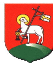
Herb Powiatu Wieluńskiego