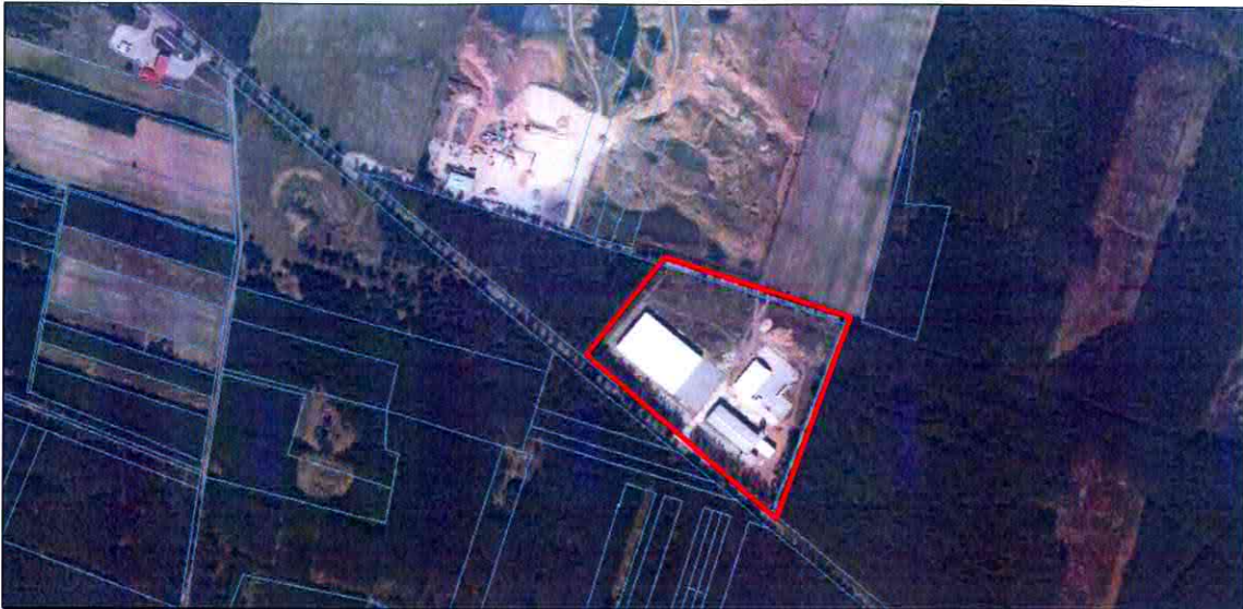
Ortofotomapa z obszarem opracowania planu

Teren objęty opracowaniem miejscowego planu zagospodarowania przestrzennego znajduje się na obszarze wymagającym szczególnej ochrony prawnej w zakresie ochrony przyrody i środowiska przyrodniczego - w granicach otuliny Załęczańskiego Parku Krajobrazowego, dla którego obowiązuje rozporządzenie Nr 45/2005 Wojewody Łódzkiego z dnia 24 listopada 2005r. w sprawie Załęczańskiego Parku Krajobrazowego w granicach województwa łódzkiego oraz rozporządzenia Nr 14 /2008 Wojewody Łódzkiego z dnia 04 czerwca 2008r. zmieniające rozporządzenie wojewody łódzkiego w sprawie załęczańskiego parku krajobrazowego, w granicach województwa łódzkiego.