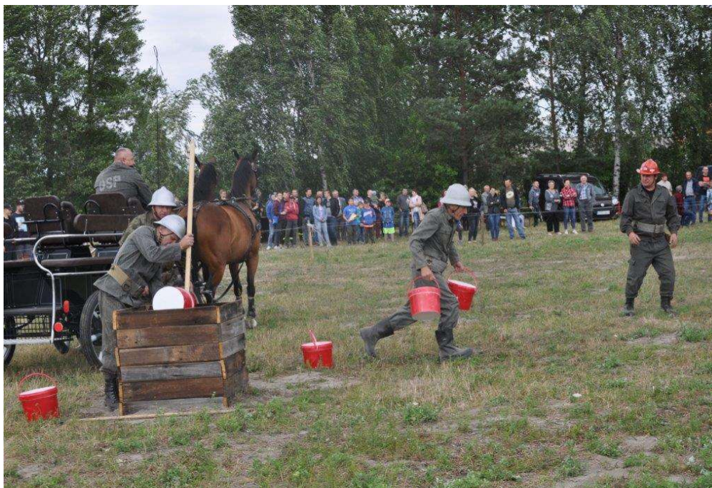
Gminne zawody sportowo-pożarnicze

i Zelgoszcz, 2 drużyny żeńskie z OSP: Biernacie i Zelgoszcz oraz drużyna oldbojów z OSP Biernacie.