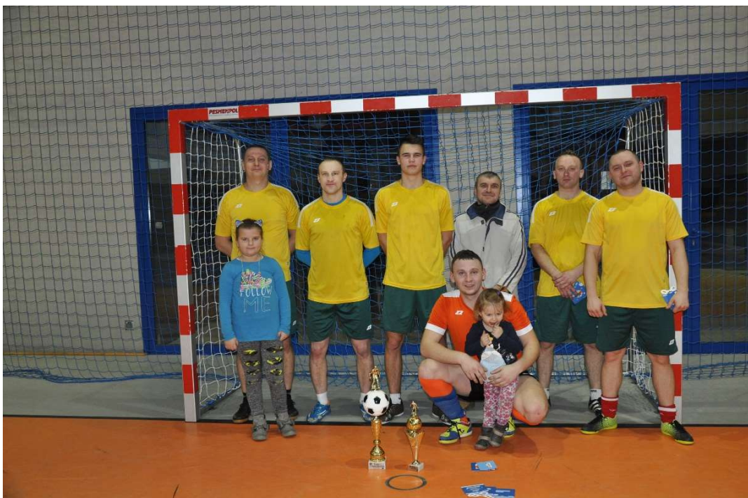
Drużyna KS Klódno – I miejsce