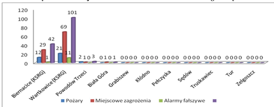
Rysunek Udział jednostek OSP w działaniach ratowniczo-gaśniczych