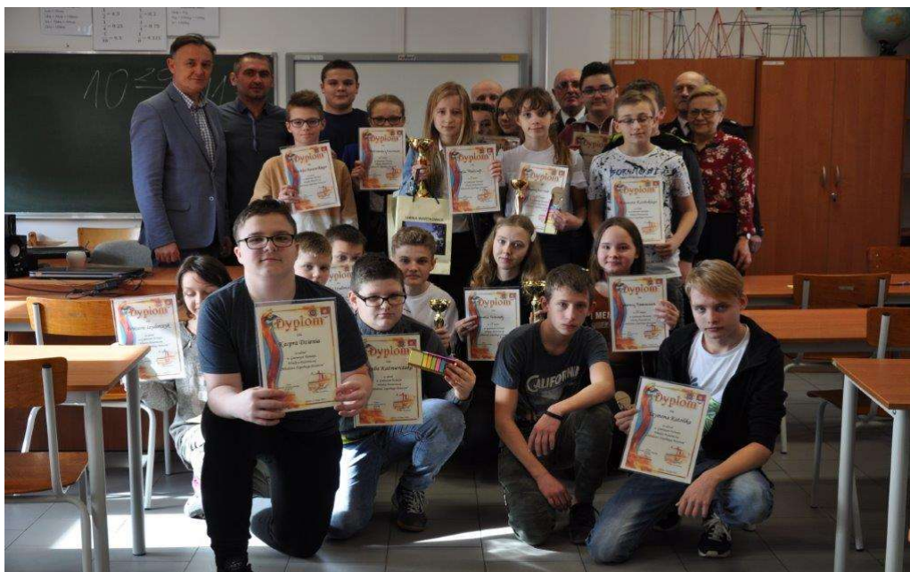
Uczestnicy turnieju „Młodzież zapobiega pożarom”