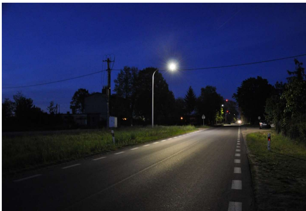
Lampa oświetlenia ulicznego w Starym Gostkowie

Roczny koszt konserwacji infrastruktury oświetlania ulicznego wyniósł 48.417,27 zł, natomiast koszt energii ekлекtycznej na potrzeby oświetlenia 108.084,67 zł.