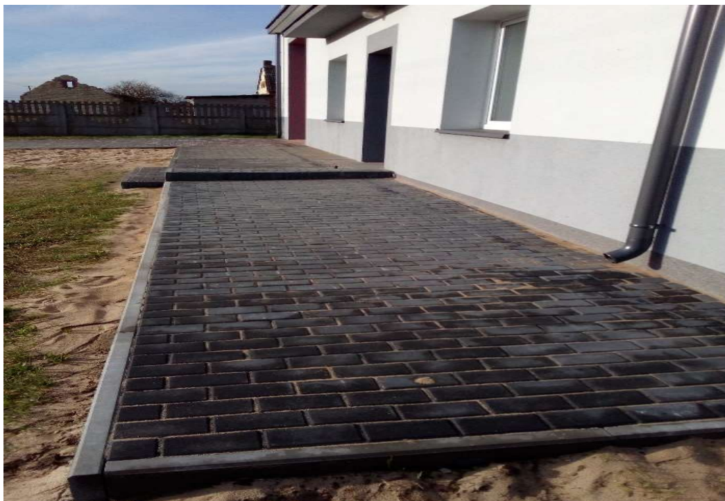
OSP w Grabiszewie

Sołectwo Dzierżawy w ramach udzielonej dotacji w wysokości 10.000,00 zł zrealizowało projekt pod nazwą „Zagospodarowanie przestrzeni publicznej w sołectwie Dzierżawy – budowa placu parkingowego” wartość całkowita 15.950,00 zł. Projekt obejmował; ułożenie kostki brukowej pod miejsca parkingowe przy budynku użyteczności publicznej, jaką jest Kościół Parafialny w Dzierżawach wraz z zagospodarowaniem terenu obejmujący między innymi nasadzenia krzewów.