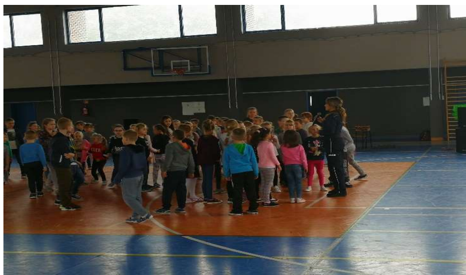
Pogadanka w Szkole Podstawowej w Wartkowicach

W 2019 r. w ramach współpracy z Komendą Powiatową Policji w Poddębicach realizowane były działania na rzecz bezpieczeństwa dzieci i młodzieży podczas akcji pn. „Świeć przykładem w szkole i na drodze”. Funkcjonariusze w porozumieniu z dyrekcją Szkoły Podstawowej w Wartkowicach i Szkoły Podstawowej w Kłodnej w miesiącach wrzesień-listopad przeprowadzili w tych placówkach prelekcje o bezpieczeństwie na drodze dla wszystkich uczniów. Podczas spotkań uczniowie otrzymali elementy odblaskowe zakupione przez Gminę Wartkowice. Zakupiono 400 odblasków w kwocie – 1.020,90 zł.