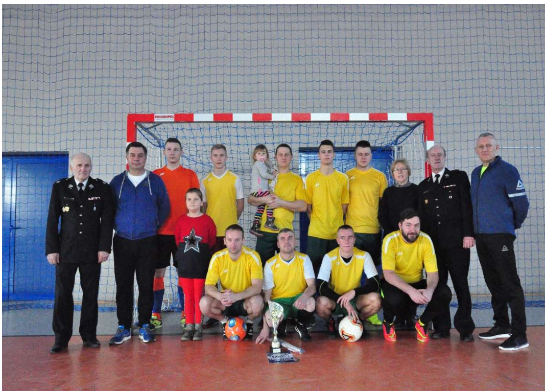
Drużyna OSP Klódno – I miejsce