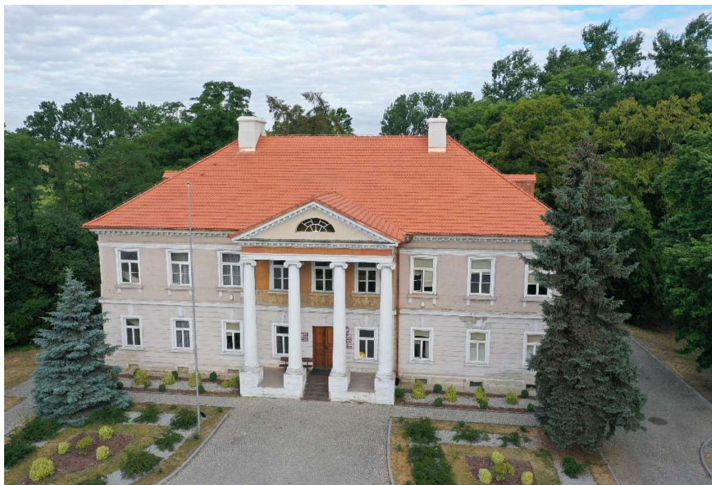
Pałac w Starym Gostkowie ( po wymianie pokrycia dachu)

Całkowita wartość zadania 439.026,00 zł, w tym dofinansowanie 277.394,00 zł.