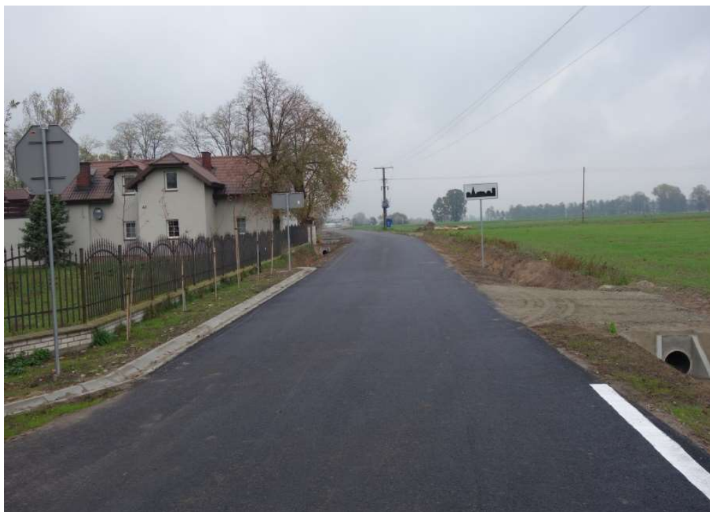
Droga gminna Orzeszków-Truskawiec