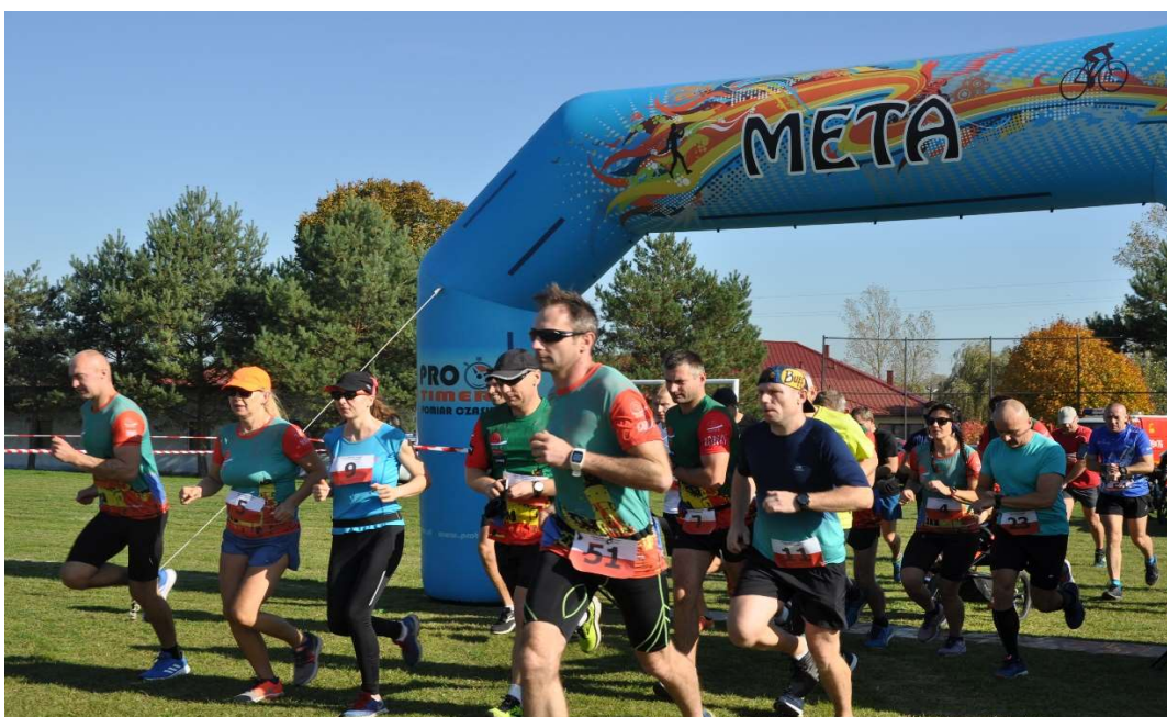
Uczestnicy II Biegu Legionów Polskich