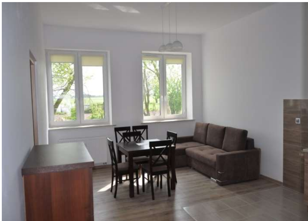
Lokal mieszkalny w Sakowie 7

Rodzina otrzymała wsparcie w załatwianiu wszelkich spraw urzędowych i administracyjnych związanych z tłumaczeniem dokumentacji niezbędnej do uzyskania polskich dokumentów.