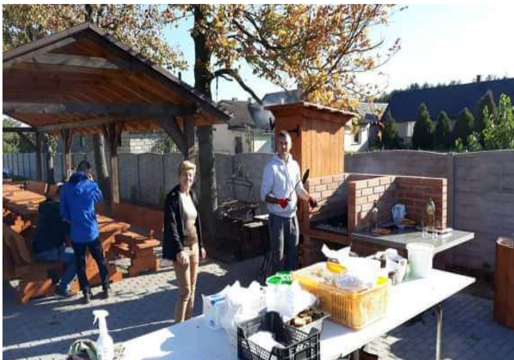
Plac na terenie OSP w Wartkowicach

Sołectwo Wartkowiec w ramach udzielonej dotacji w wysokości 6.000,00 zł, zrealizowano projekt pod nazwą „Stworzenie miejsca integracji wśród mieszkańców sołectwa Wartkowiec poprzez zagospodarowanie przestrzeni publicznej” wartość całkowita 9.100,00 zł. Projekt był realizowany na terenie działki użytkowanej przez OSP Wartkowiec. Obejmował: budowę grilla i ułożenie wokół niego kostki brukowej, wykonanie drewnianych stołów i ławek, nasadzenia krzewów oraz spotkanie integracyjne.