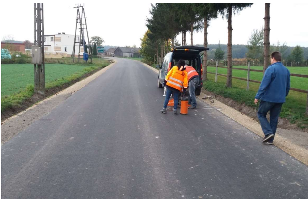
Droga gminna Biała Góra - Starzyny

Na realizację zadania pozyskano dotację ze środków budżetu Województwa Łódzkiego, pochodzących z tytułu wyłączenia z produkcji gruntów rolnych w kwocie 87.987,00 zł.