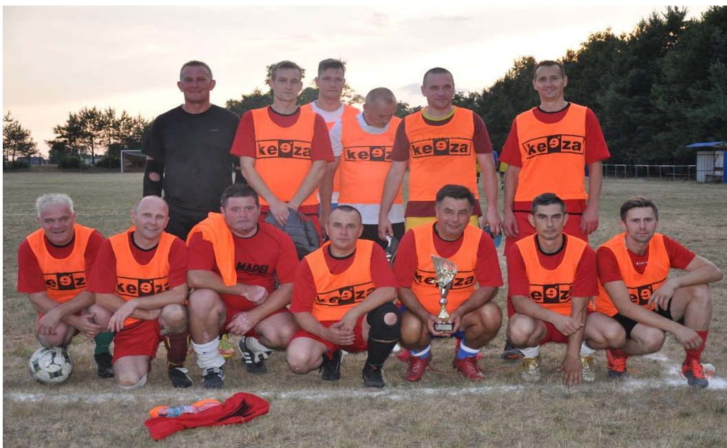
Drużyna Oldboys Wartkowiec – I miejsce