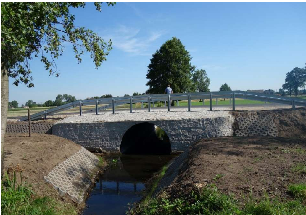
Przepust - Wierzbowa