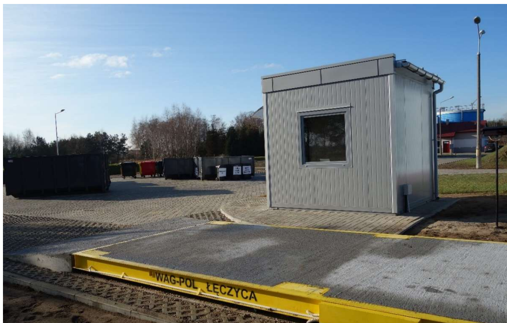
Punkt Selektywnej Zbiórki Odpadów Komunalnych w Wartkowicach