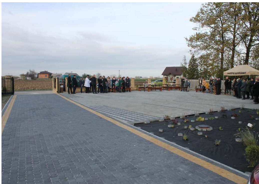
Plac parkingowy przy Kościele w Dzierżawach

Sołectwo Dzierżawy w ramach udzielonej dotacji w wysokości 10.000,00 zł zrealizowało projekt pod nazwą „Zagospodarowanie przestrzeni publicznej w sołectwie Dzierżawy – budowa placu parkingowego” wartość całkowita 15.950,00 zł. Projekt obejmował; ułożenie kostki brukowej pod miejsca parkingowe przy budynku użyteczności publicznej, jaką jest Kościół Parafialny w Dzierżawach wraz z zagospodarowaniem terenu obejmujący między innymi nasadzenia krzewów.