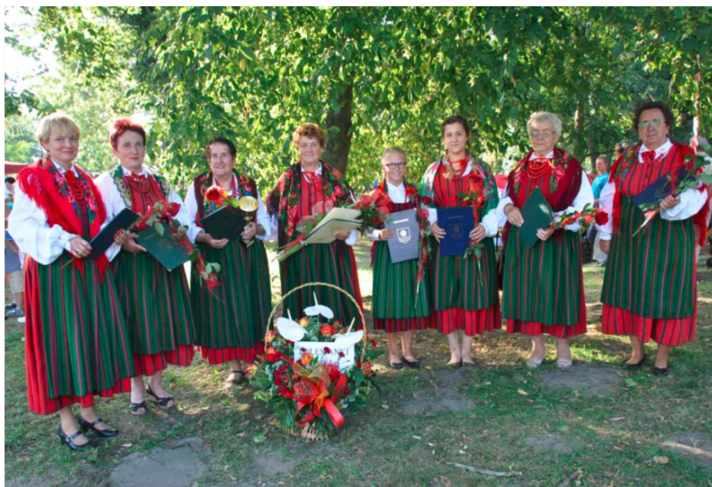
Ludowy Zespół Śpiewaczy „Polesianki”

Na terenie gminy Wartkowice działa Zespół Śpiewaczy „Polesianki”, który istnieje już od 1986 r. Zespół Śpiewaczy „Polesianki” od początku swego istnienia czynnie włącza się w życie gminy uświetniając wiele uroczystości patriotycznych, religijnych i kulturalnych. „Polesianki” prezentują pieśni ludowe regionu łęczyckiego. Obecnie skład zespołu liczy 11 osób.