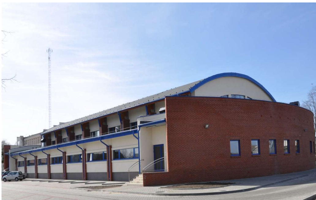
Hala sportowa w Wartkowicach