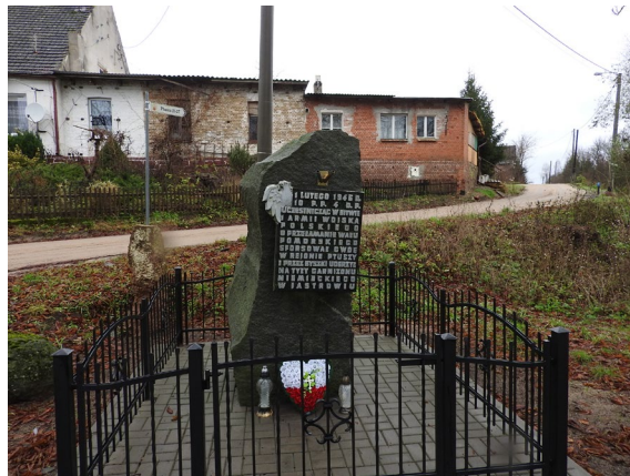
Miejsce pamięci pomordowanych w II wojnie św.