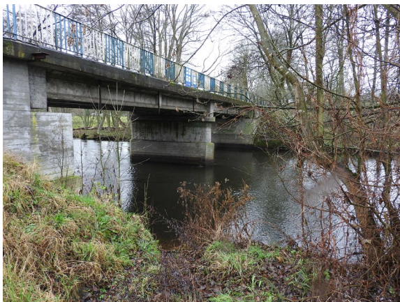
Most na rzece Gwda, wybudowany w II połowie XX wieku