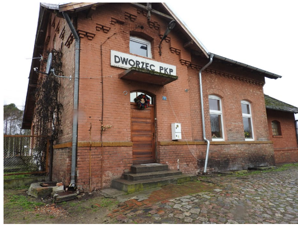
Budynek dworca PKP