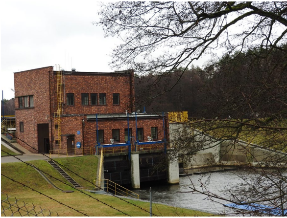
Budynek elektrowni wodnej (z pocz. XX wieku)