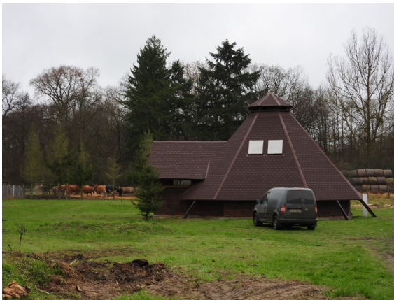
Wiatła Wigwam wraz z terenem rekreacyjnym