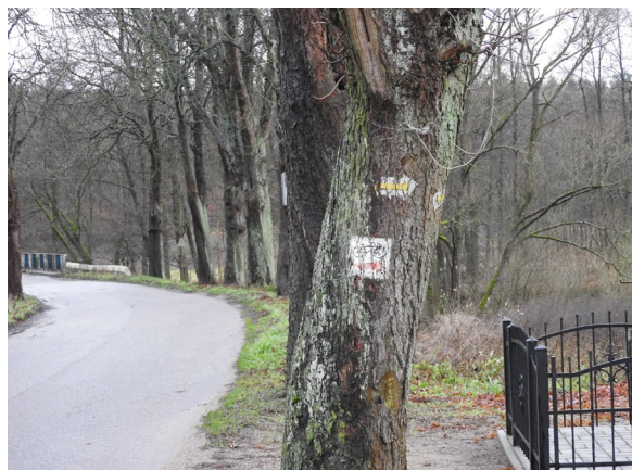
Szlak rowerowy Nadleśnictwa Złotów - czerwony