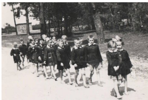
Pierwsi uczniowie szkoły powszechnej .