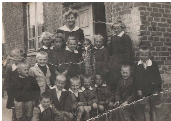
Pierwsi uczniowie przed budynkiem szkoły powszechnej.

W latach 1947-48 przeprowadzono reformę rolną w wyniku, której pracownicy dworu otrzymali po 5 h ziemi należącej do dziedzica Skarzyńskiego i ½ h łąki.