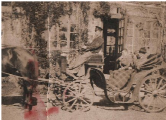
Dwór w Wylinach należący do rodziny Skarzyńskich

W okresie międzywojennym folwark dworski liczył 5 domów z 130 mieszkańcami.