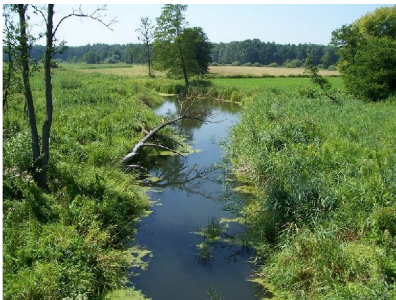
Granica Gminy Szepietowo – rz. Mianka, Wyliny Ruś

Teren sołectwa Wyliny-Ruś posiada bardzo bogate jak na warunki gminy Szepietowo zasoby przyrodnicze. W ograniczeniu sołectwa znajduje się jeden z największych kompleksów leśnych w regionie. Przez tereny należące do ograniczenia sołectwa przepływa rzeka Mianka, która wraz z otaczającymi terenami tworzy ciekawy kompleks przyrodniczo-turystyczny.