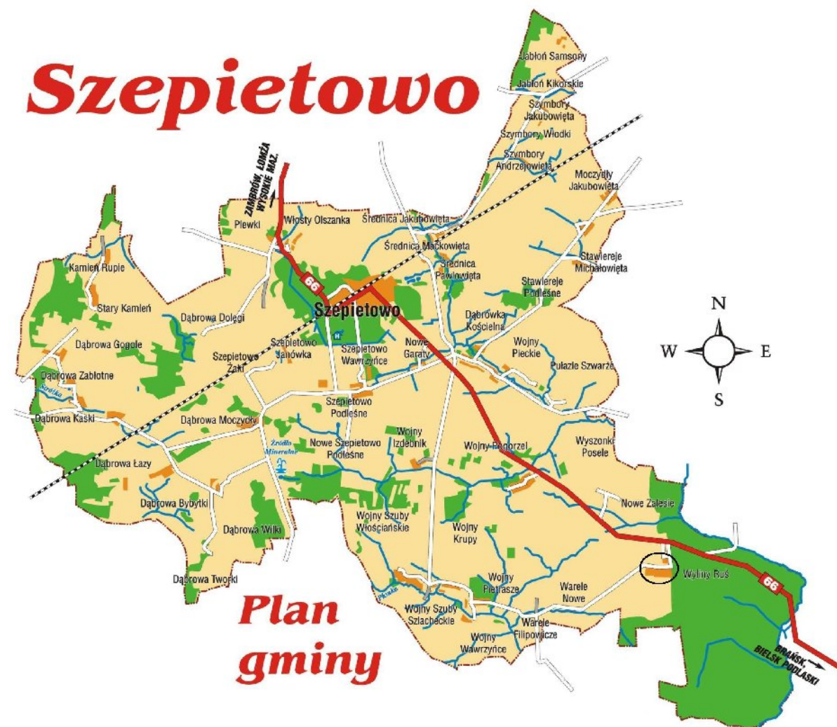
Mapa zaznaczenie Wyliny Ruś

Położenie miejscowości w Gminie Szepietowo pokazuje poniższa mapa: