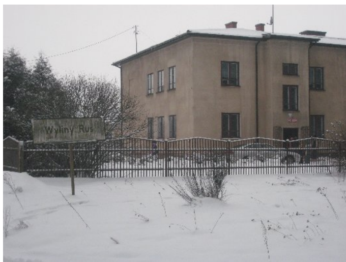
Szkoła Podstawowa w Wylinach - Rusi

wzrosła liczba uczniów, nie było klas łączonych, sprowadzono wiele pomocy naukowych, środków audiowizualnych, wzmocniła się baza materiałowa szkoły. Wybudowano dodatkowo budynek gospodarczy, posadzono drzewa, utworzono sad i ogród, a przede wszystkim ogrodzenie całej posesji. Podłączono budynek do sieci radiofonicznej. Pod koniec lat 50 tych nauczyciele podjęli naukę na zaocznych studiach wyższych. Od 1964 roku datują się kolejne zmiany, przybywa nauczycieli i uczniów. Zaczęły pojawiać się braki lokalowe wprowadzono więc zmianowość zajęć lekcyjnych. W roku szkolnym 1966/67 liczba dzieci wzrosła do 121. W tym czasie wytyczne Ministra Oświaty zalecały powstanie klasy 8 jako kończącej szkołę podstawową. Mimo nowego budynku szkoły w dalszym ciągu brakowało sal lekcyjnych, w związku z tym zajęcia odbywały się ponownie w wynajętych lokalach. Największa liczba uczniów była w roku szkolnym 1978/79 i wynosiła 124. Gwałtowny spadek liczby dzieci nastąpił w następnym roku szkolnym 1979/80 po odejściu ze szkoły ze względu na trudne warunki lokalowe uczniów ze wsi Warele Nowe. Po odejściu dużej grupy dzieci zaczęto zastanawiać się nad sposobem modernizacji placówki. Dokonano tego w latach 1987-89 poprzez dobudowanie skrzydła, w którym znajdują się: pokój nauczycielski, biblioteka, sklepik uczniowski, łazienki, a na piętrze budynki dwa mieszkania służbowe. 5 listopada 1988 r odbyło się uroczyste otwarcie dobudowanej części szkoły.