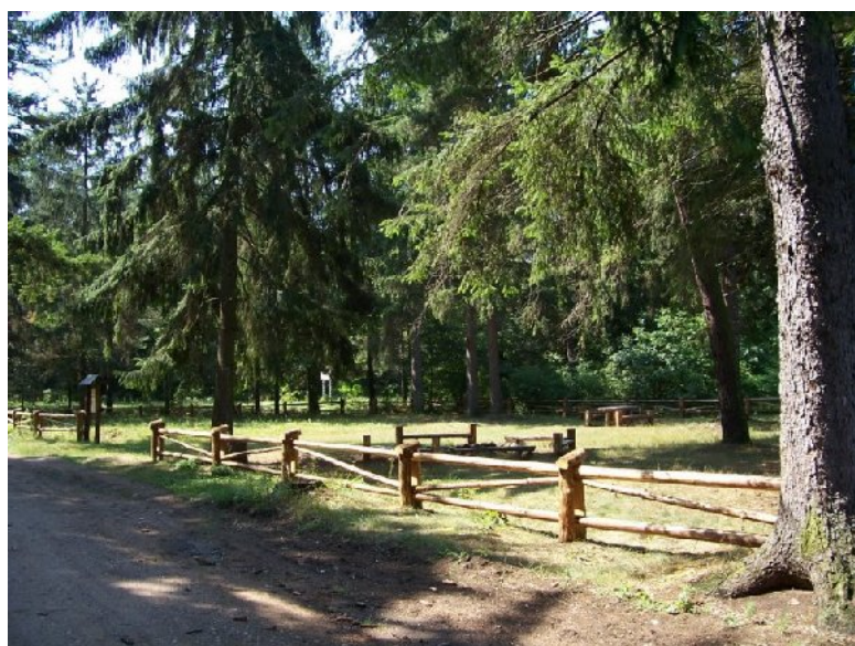
Kompleks leśny w Wylinach - Rusi