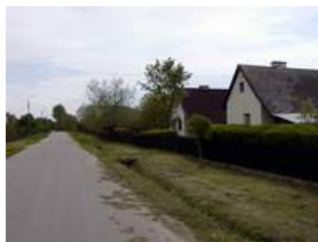
Budynki spółdzielni produkcyjnej.