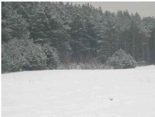
„Krucza Góra” widok obecny