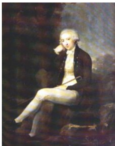
Józef Kajetan Ossoliński herbu Topór – polski hrabia , kasztelan podlaski

W drugiej połowie XVIII wieku dobra Wyliny (tak zwano ten majątek) znalazły się w ręku Józefa Kajetana Ossolińskiego (1758-1834), wielkiego możnowładcy Podlasia, dziedzica Rudki (koło Brańska).