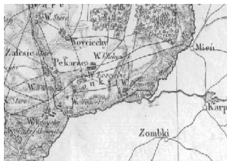
Okolice szlachecka Wyszonki na mapie Królestwa Polskiego z 1839r

Hrabia Wiktor Ossoliński zmarł w 1860 roku bezdziejnie, a jego ogromny majątek-120ha użytków rolnych i 2000 ha lasu uległy rozproszeniu. Dobra Wylin trafiły w ręce magnackiego rodu Zamoyskich, aż do końca I. wojny światowej.