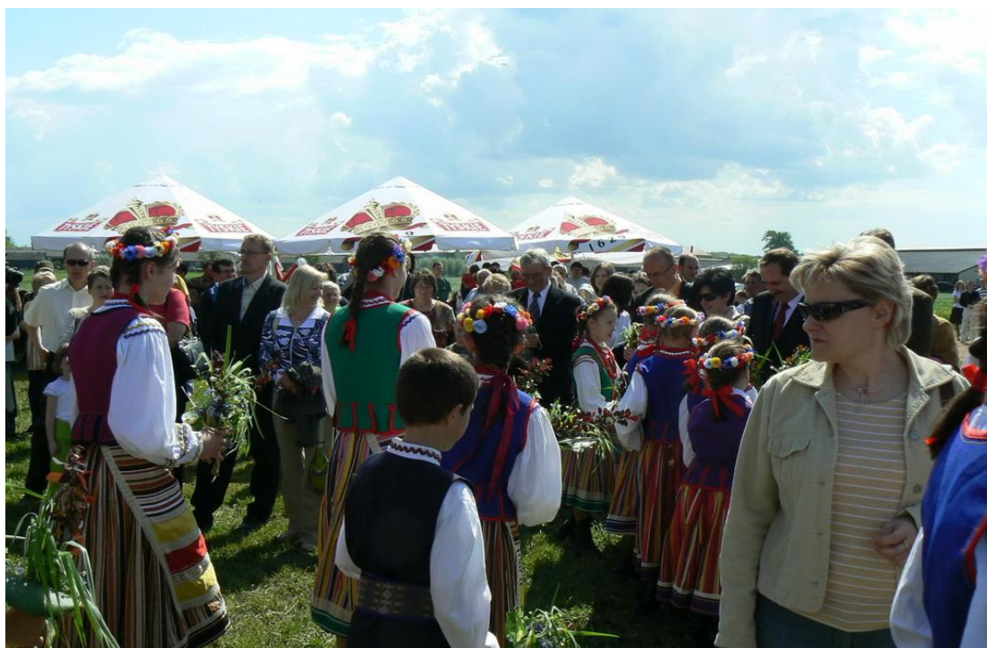
„Zielone Świątki pod wiatrakiem” w 2008 r.

Uczestnicy imprezy biorą udział w obrzędach poświęcenia pól. Tradycyjnym obrzędem towarzyszą występy zespołów i kapel ludowych, przejażdżki bryczką i zwiedzanie wiatraka.