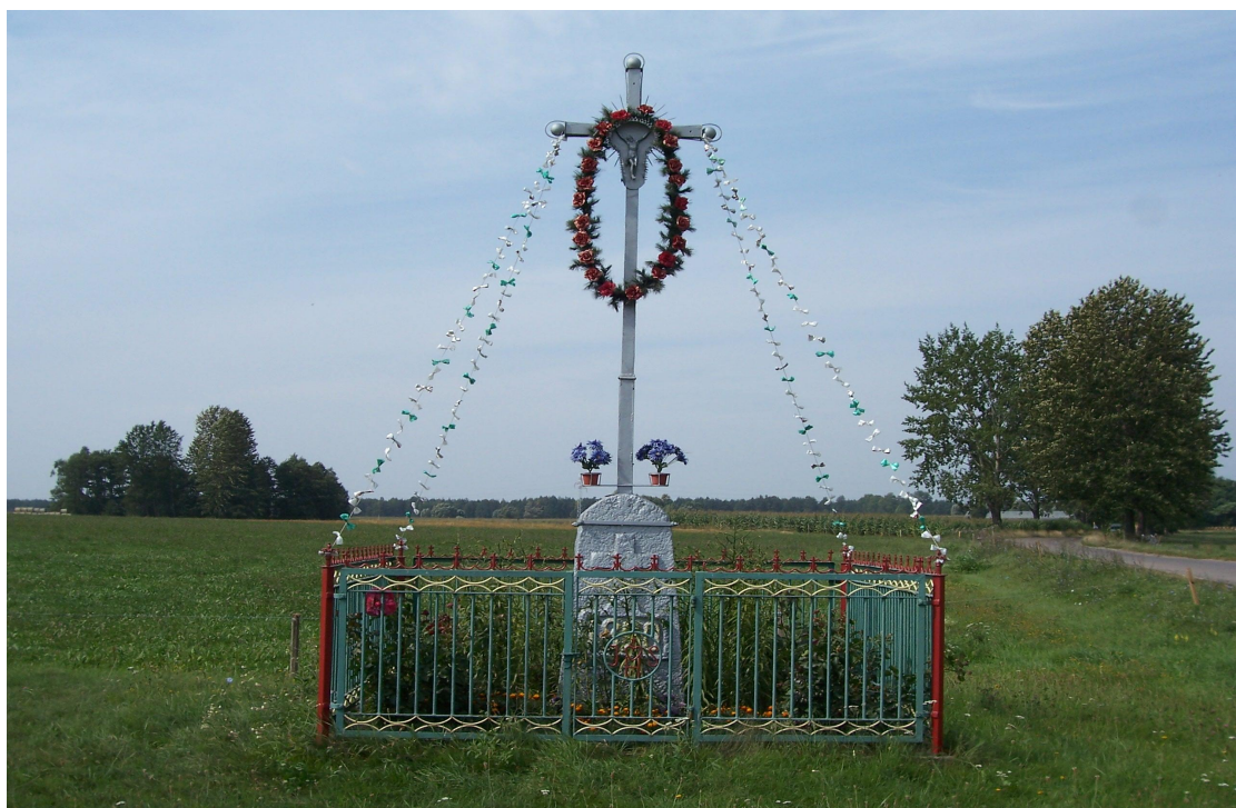
Krzyż przydrożny z 1890 r.