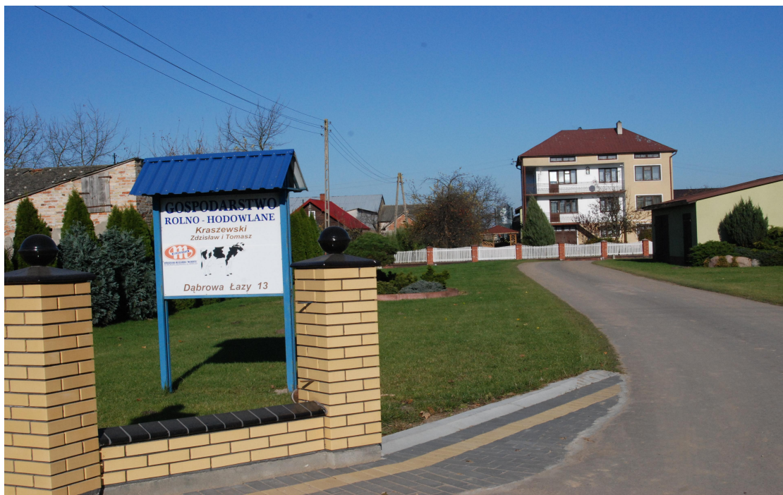
Nowoczesne gospodarstwo rolne nastawione na produkcję mleka Zdzisława i Tomasza Kraszewskich w Dąbrowie – Łazach.