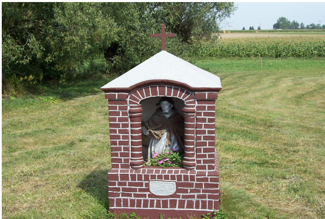
Kapliczka św. Jana Nepomucena.