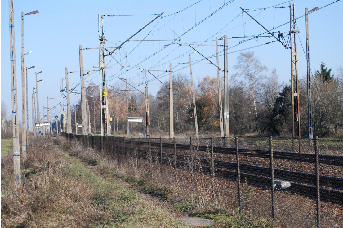
Tory kolejowe w Dąbrowie – Łazach.

- przystanek kolejowy – funkcjonujący od grudnia 1987 r. Przystanek powstał dzięki inicjatywie mieszkańców miejscowości. Rozważane było również zlokalizowanie przystanku we wsi Szepietowo – Żaki, jednak duże zaangażowanie i operatywność mieszkańców sprawiły, że podjęto decyzję o utworzeniu przystanku PKP w Dąbrowie – Łazach.