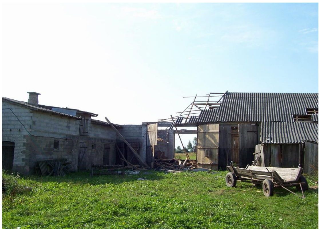
Zniszczenia spowodowane przez huragan Dąbrowie – Łazach.