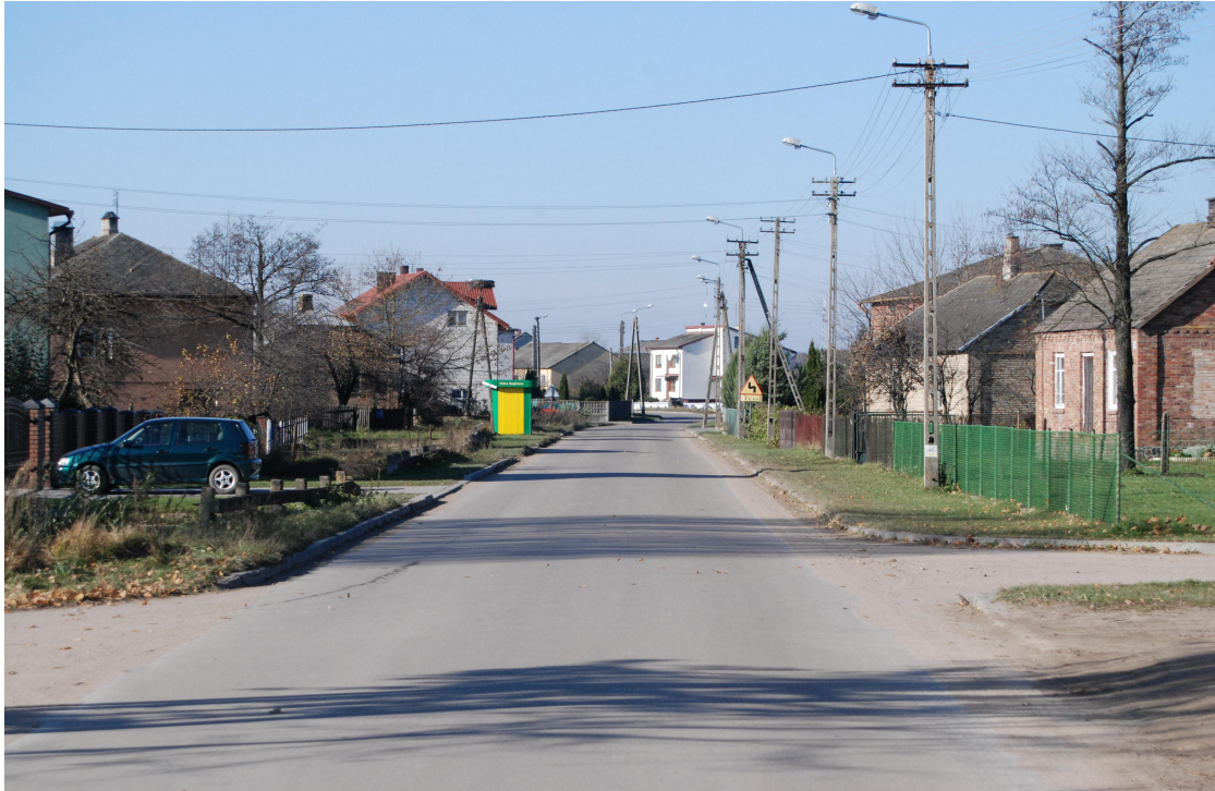
2009 r. – zniszczenia po huraganie zostały w większości naprawione.

W związku z powyższym zasadnym będzie fakt ukierunkowania planu odnowy miejscowości pod kątem poprawy infrastruktury technicznej miejscowości, która doznała poważnych zniszczeń w związku z opisanym wyżej huraganem.