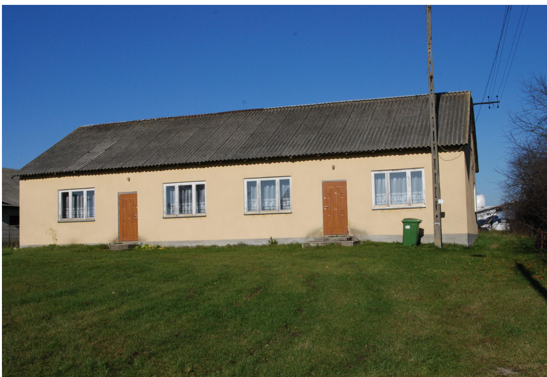
Budynek przewidziany do remontu pod kątem prowadzenia świetlicy.

Główną inwestycją planowaną w ramach działań na rzecz odnowy miejscowości ma być urządzenie świetlicy w Dąbrowie - Łazach. Inwestycja obejmować ma remont istniejącego budynku i prowadzenia działalności w ramach świetlicy. W chwili obecnej pomieszczenie nie nadaje się do prowadzenia przedmiotowej działalności.