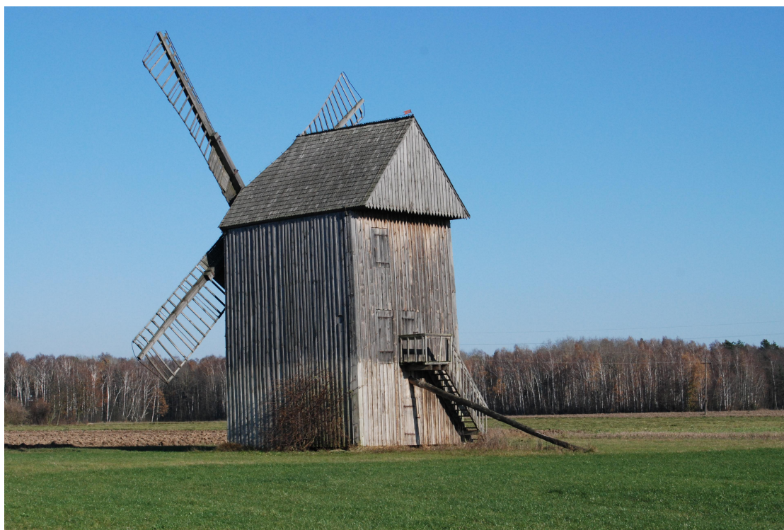
Wiatrak w Dąbrowie – Łazach.

Najbardziej charakterystycznym zabytkiem w Dąbrowie – Łazach jest wspomniany wcześniej wiatrak. Jest to duży, drewniany obiekt typu koźlak. Wiatrak został zbudowany w latach 20 – tych XX w., do Dąbrowy Łazów został przeniesiony tuż po wojnie, w 1946 r. Do połowy lat 70 – tych ub. w. był wykorzystywany do mielenia zboża na mąkę. W tamtym okresie wiatrak ten miał duże znaczenie dla lokalnej ludności, gdyż jak już wspomniano był to duży obiekt i umożliwiał mielenie znacznych ilości zboża. W 1986 r. został odkupiony od prywatnego właściciela przez Muzeum Rolnictwa w Ciechanowcu. W kolejnych latach został odrestaurowany i do dzisiejszego dnia pozostaje najbardziej charakterystycznym obiektem Dąbrowy – Łazów, i jednym z najbardziej charakterystycznych w całej gminie Szepietowo.