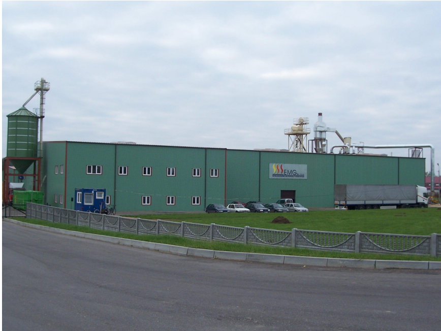
Ekologiczne Materiały Grzewcze Sp. z o.o.

W Szepietowie zlokalizowanych jest 7 sklepów spożywczych, 4 sklepy przemysłowe, 2 sklepy ze sprzętem AGD-RTV, sklep odzieżowy a także restauracja.