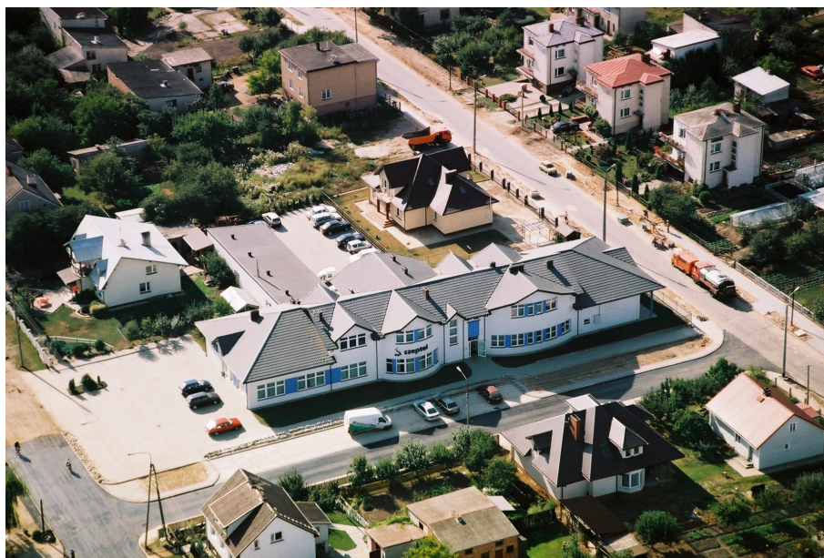
MNI Telecom S.A.