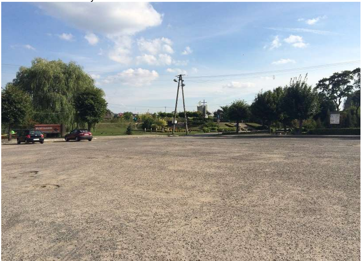
Widok 10 – Plac Straży