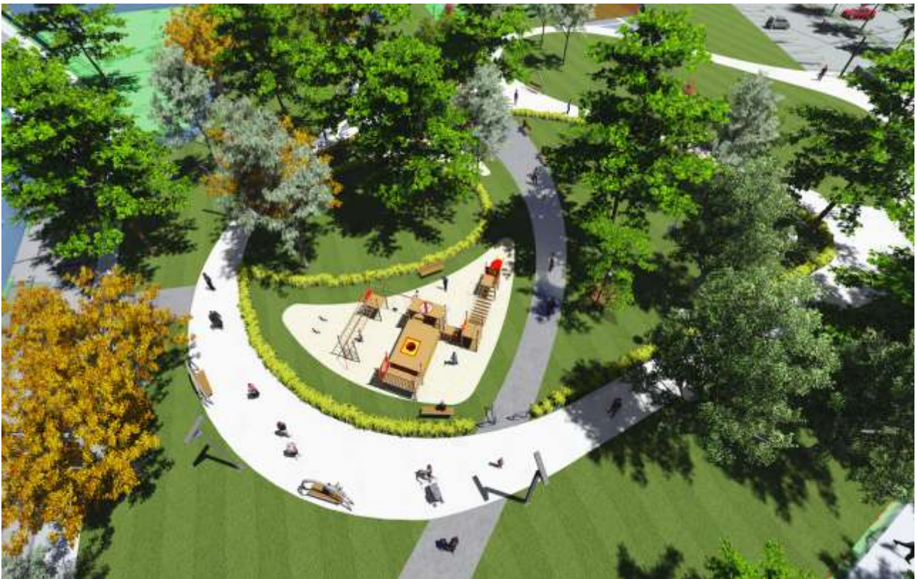
Ugór miejski przy ul. Szkolnej