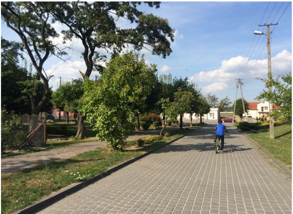
Widok 12 – Plac Straży