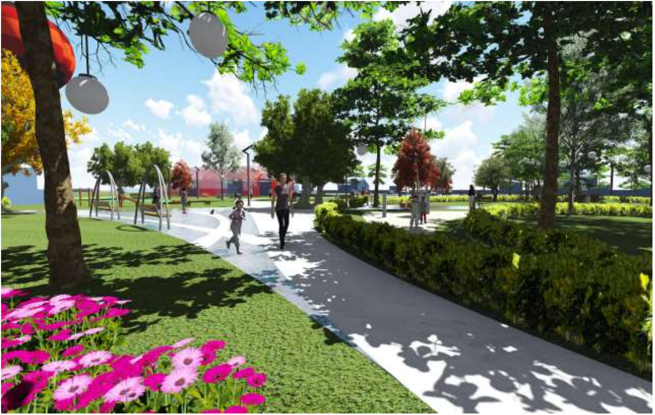
Ugór miejski przy ul. Szkolnej