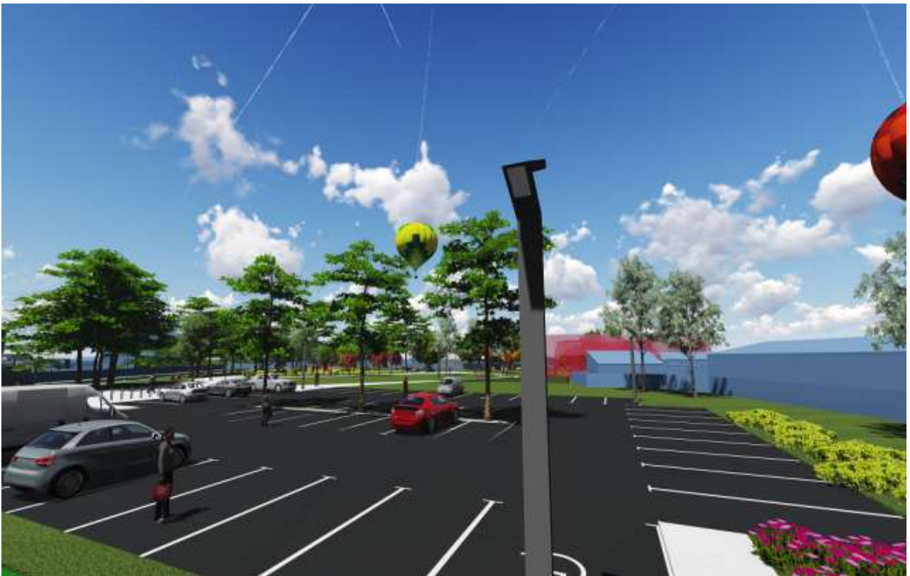
Ugór miejski przy ul. Szkolnej