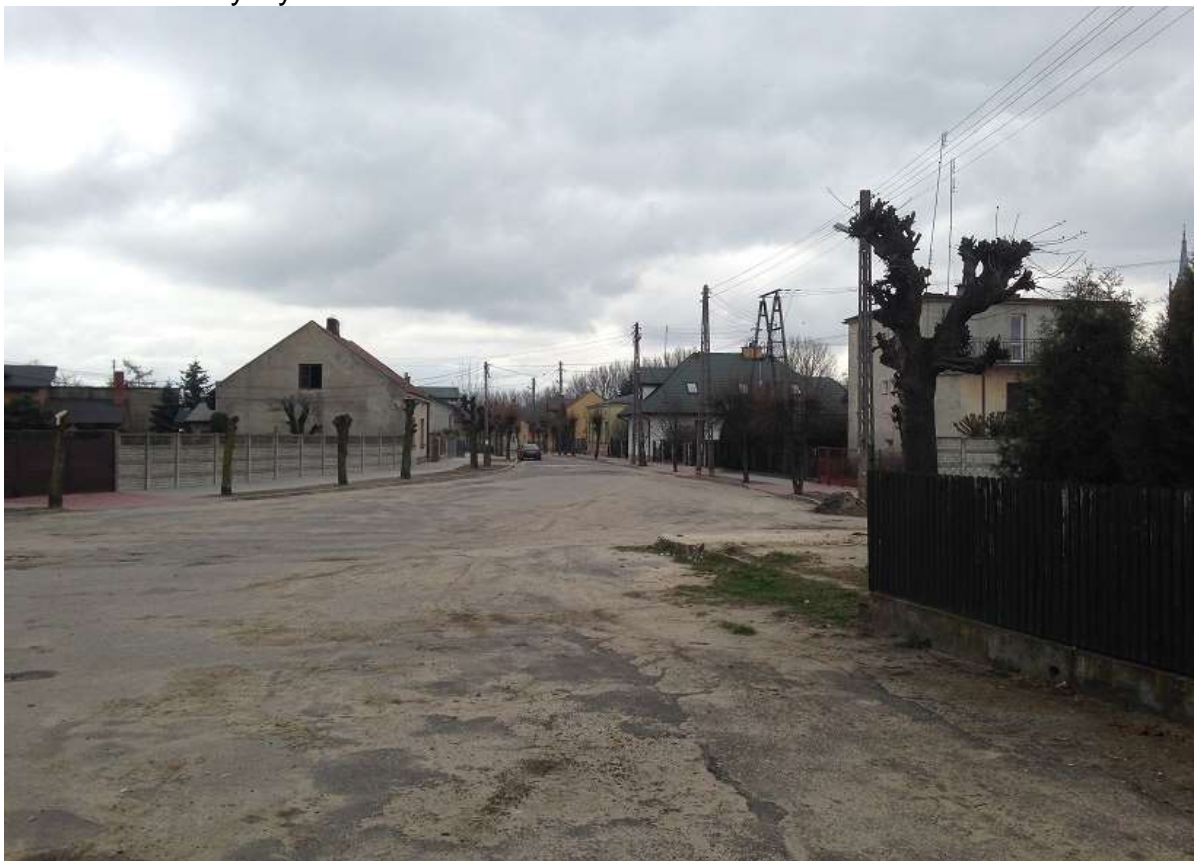
Widok 18 – Stary Rynek