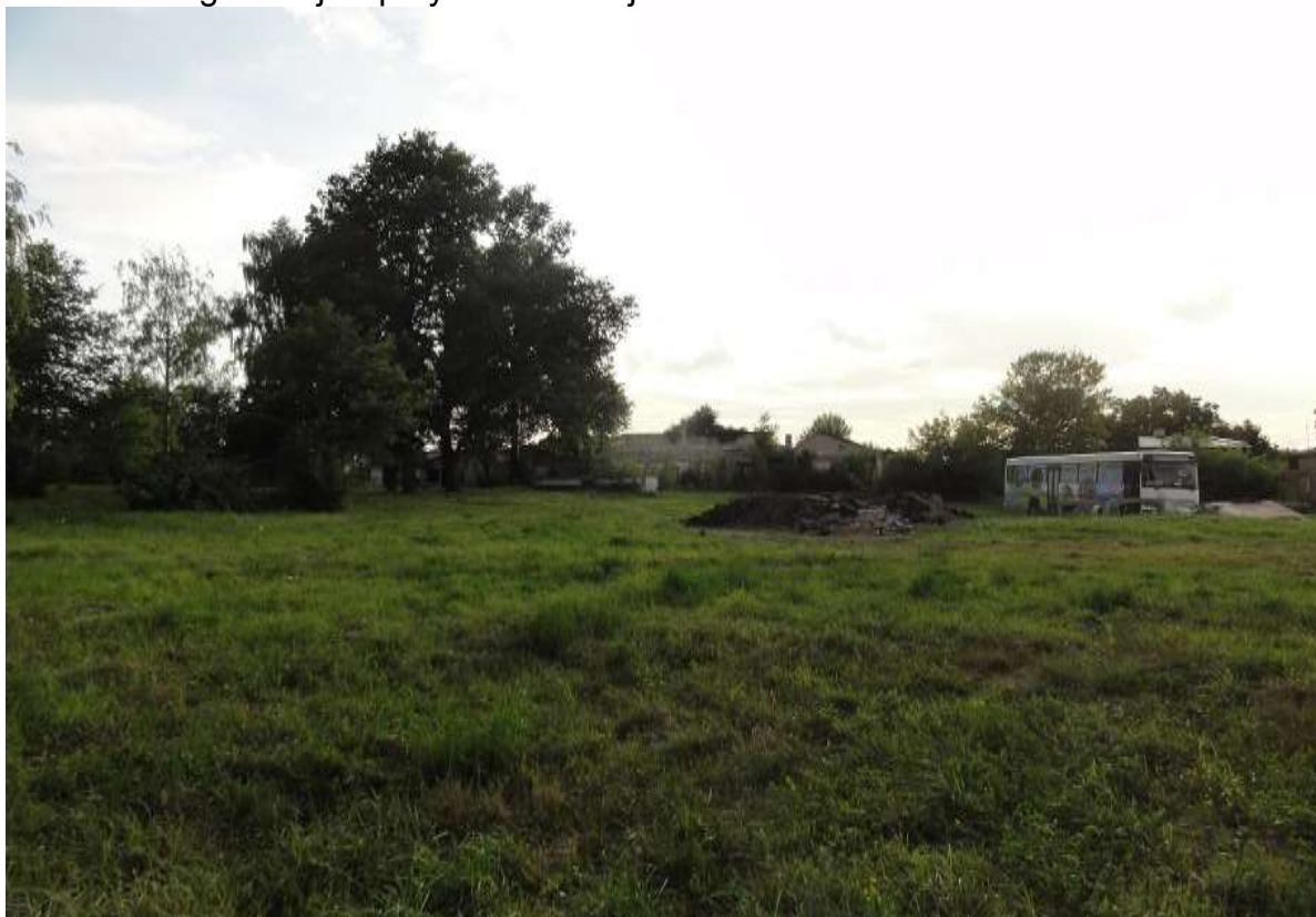
Widok 2 – Ugór miejski przy ul. Szkolnej