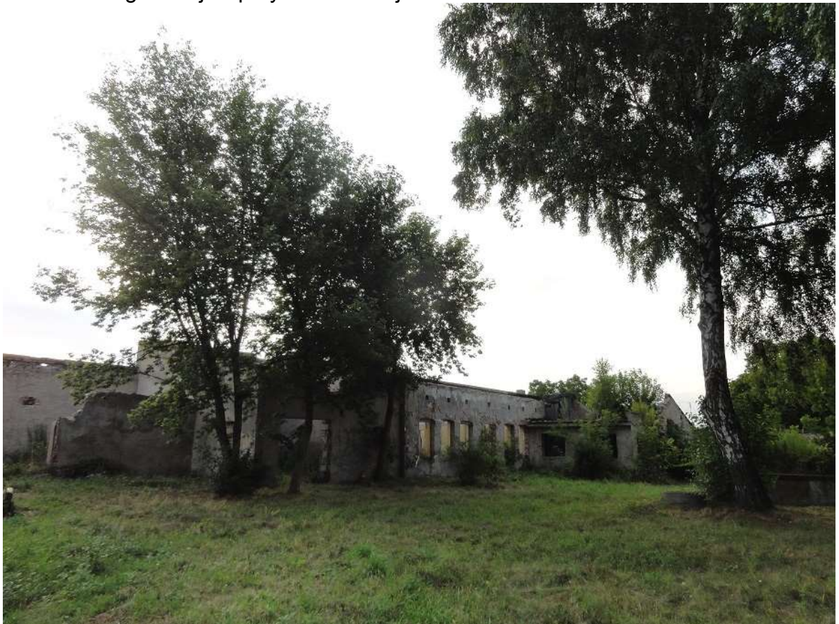
Widok 6 – Ugór miejski przy ul. Szkolnej