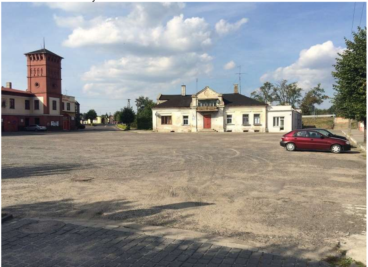
Widok 8 – Plac Straży