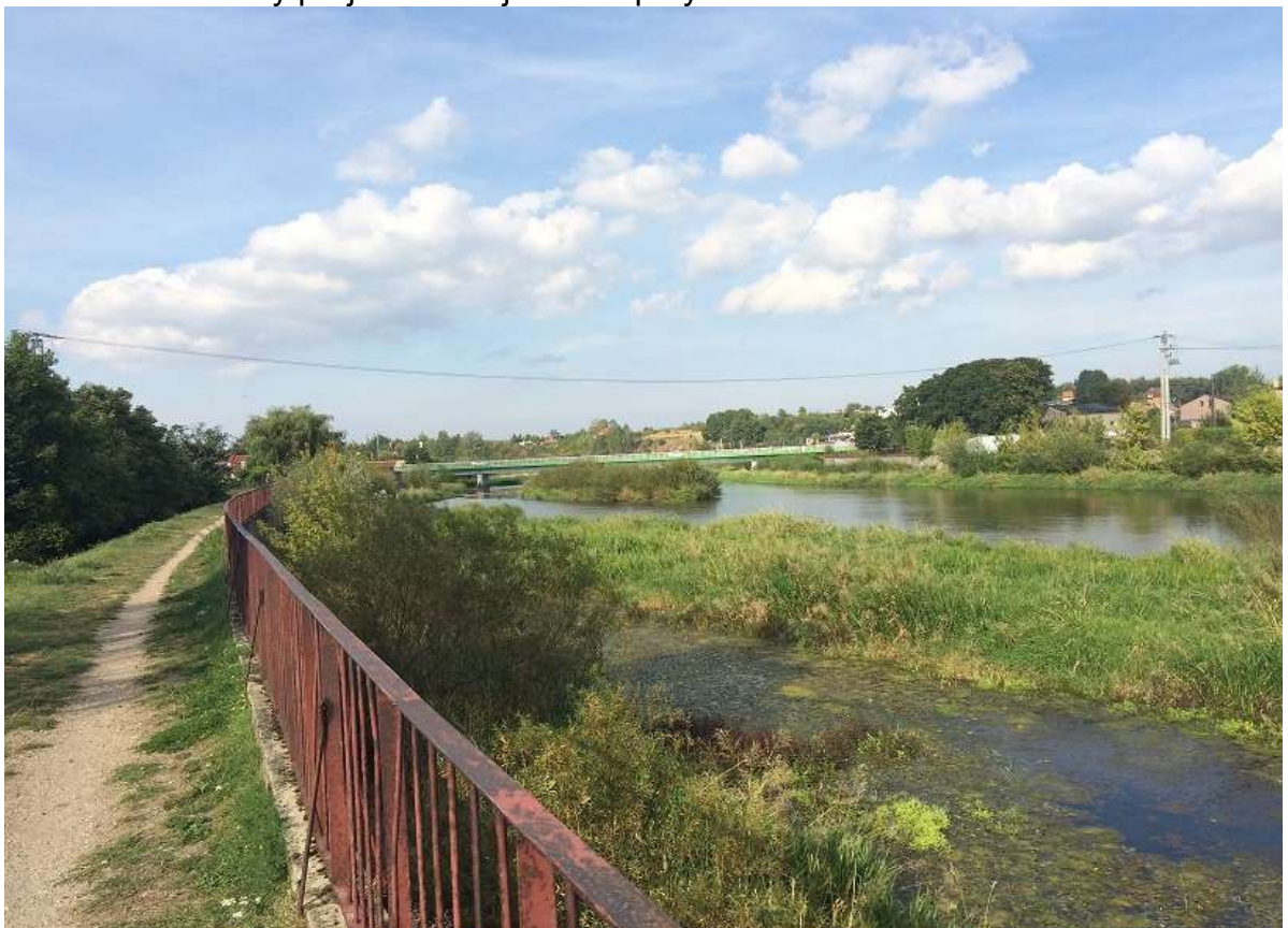
Widok 14 – Tereny projektowanej kładki i przystani