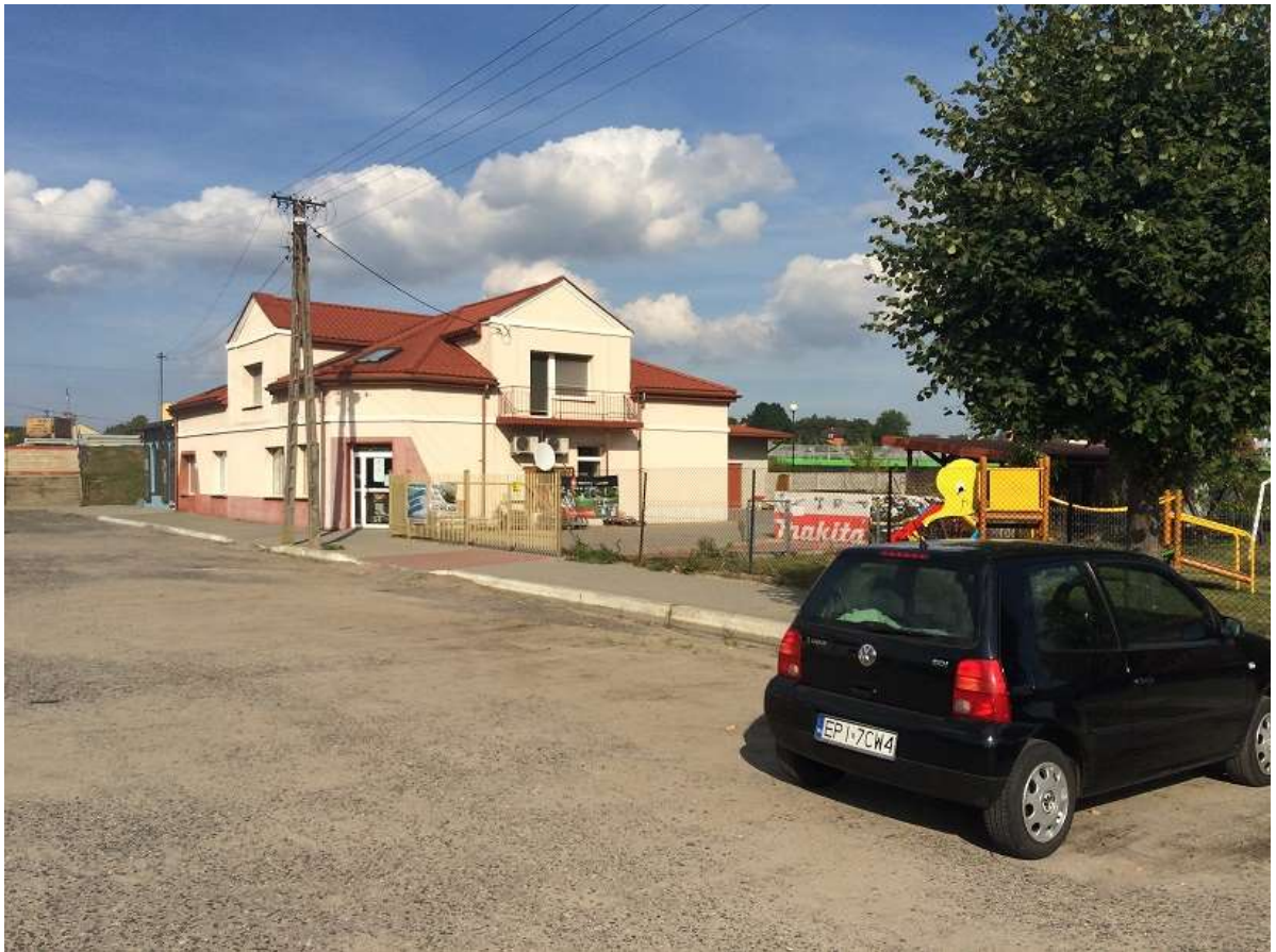
Widok 9 – Plac Straży