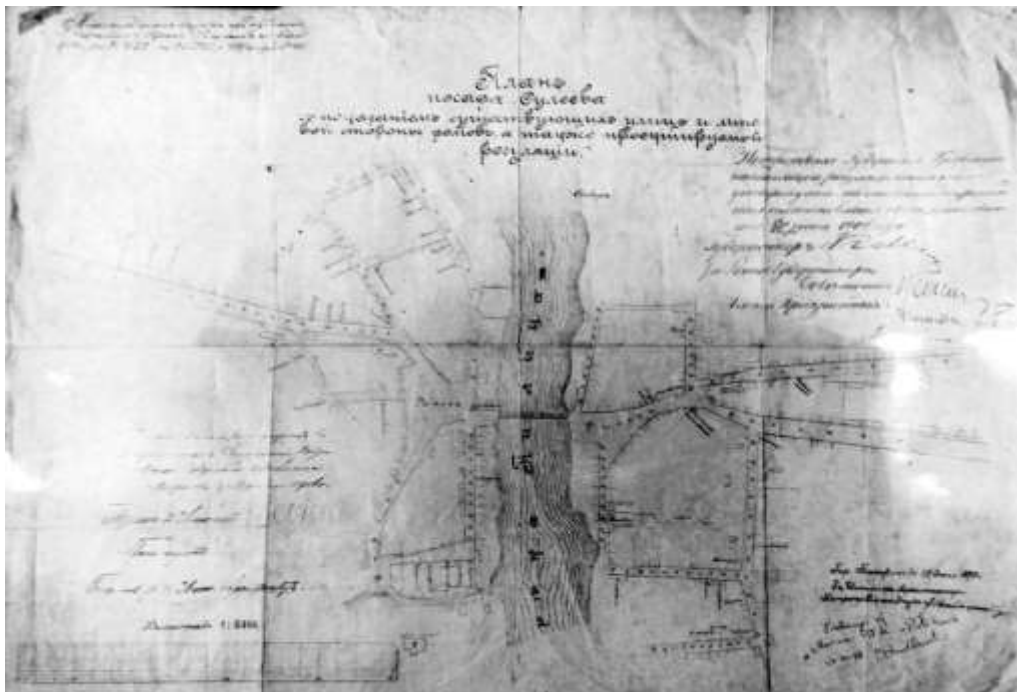
Plan miasta Sulejowa z 1904r.