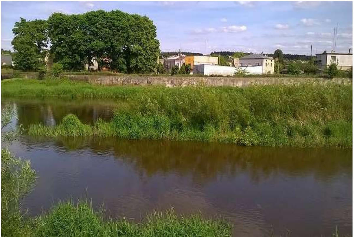
Widok 15 – Tereny projektowanej kładki i przystani