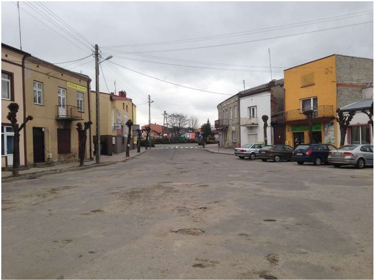
Widok 17 – Stary Rynek