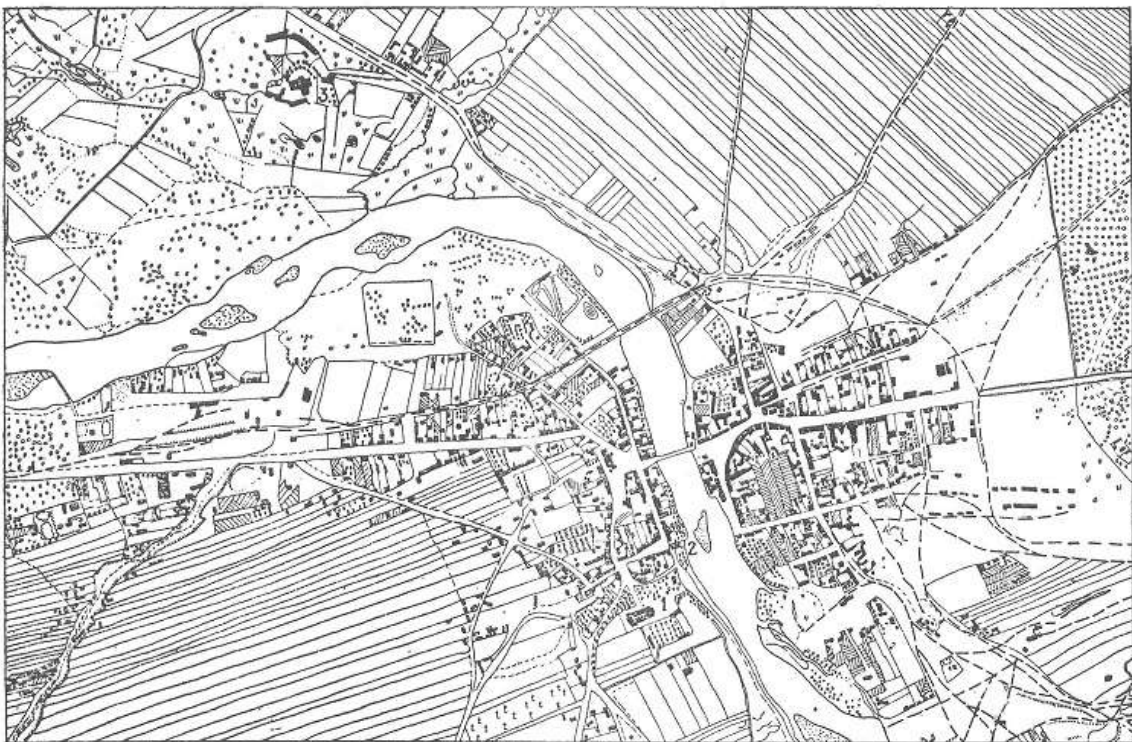
Układ urbanistyczny Sulejowa z 1898r.