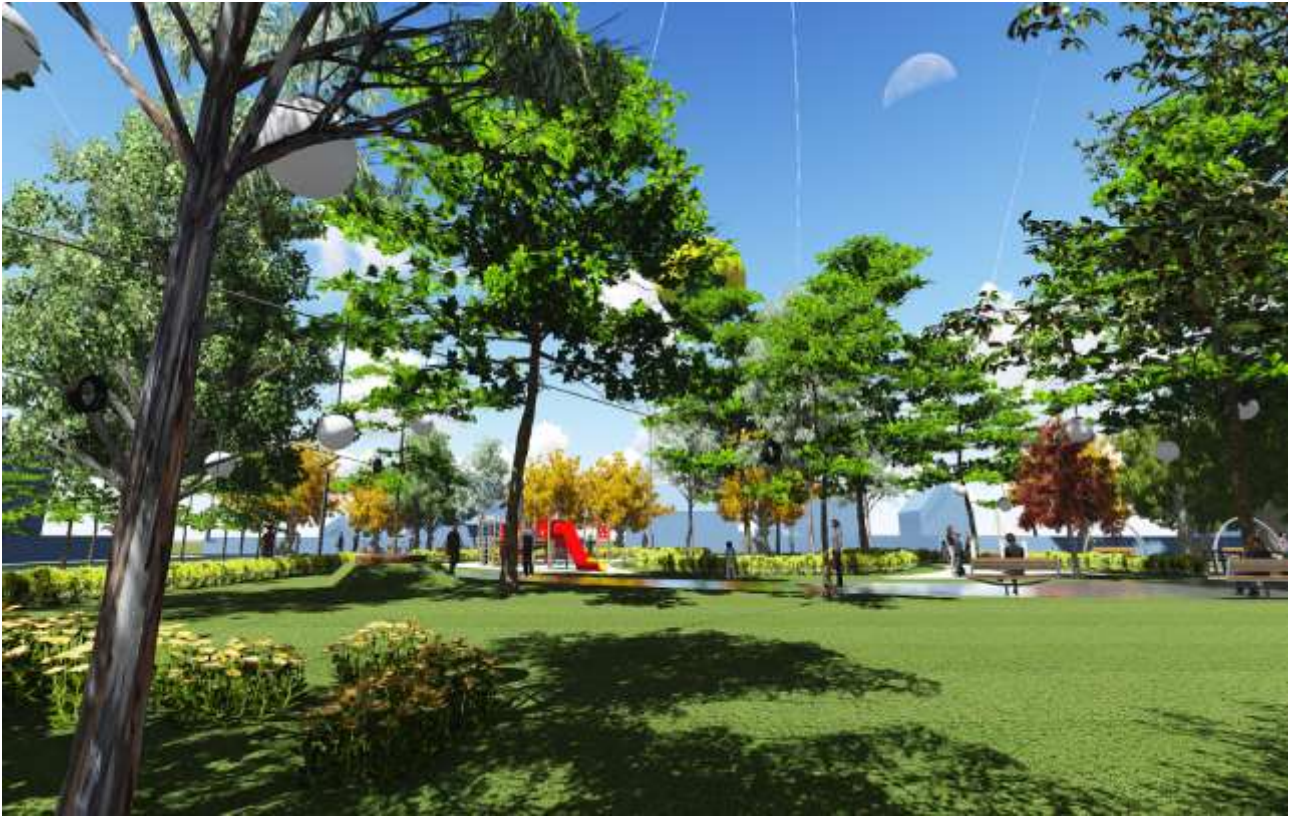
Ugór miejski przy ul. Szkolnej