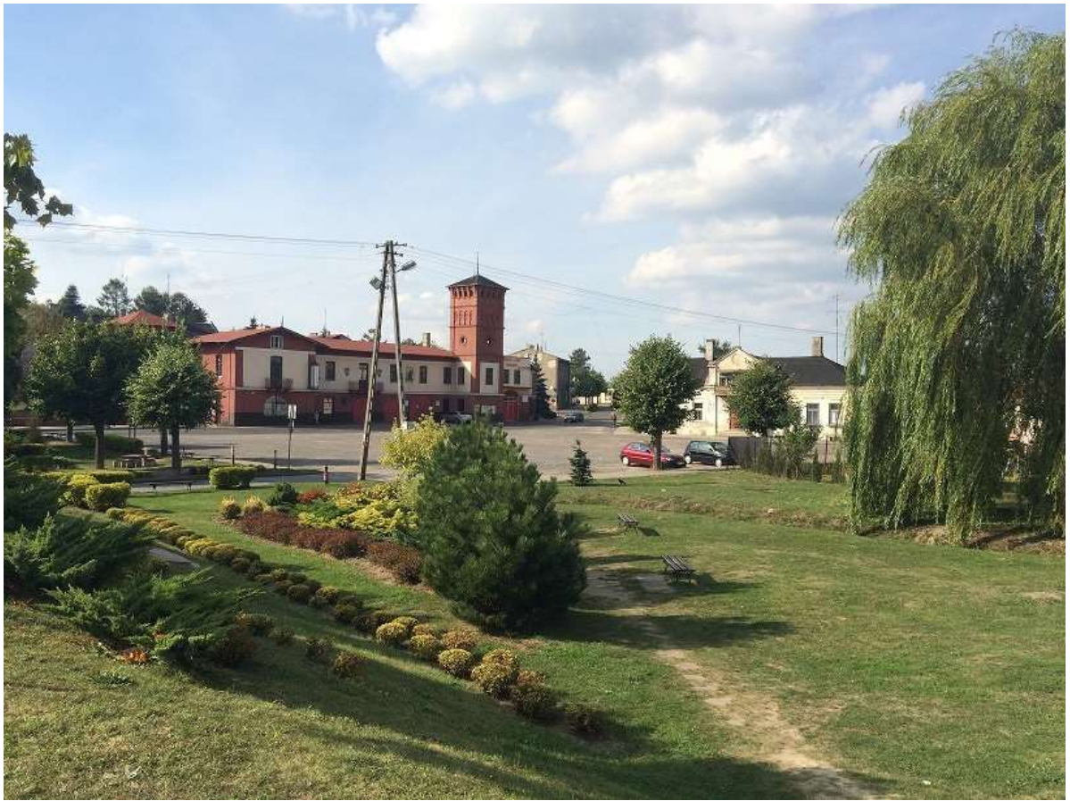
Widok 11 – Plac Straży