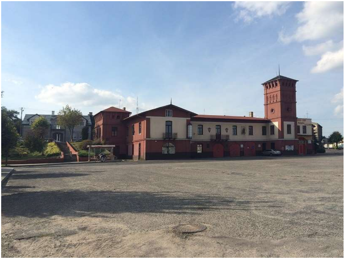
Widok 7 – Plac Straży