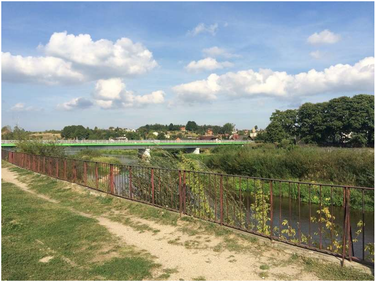
Widok 13 – Tereny projektowanej kładki i przystani