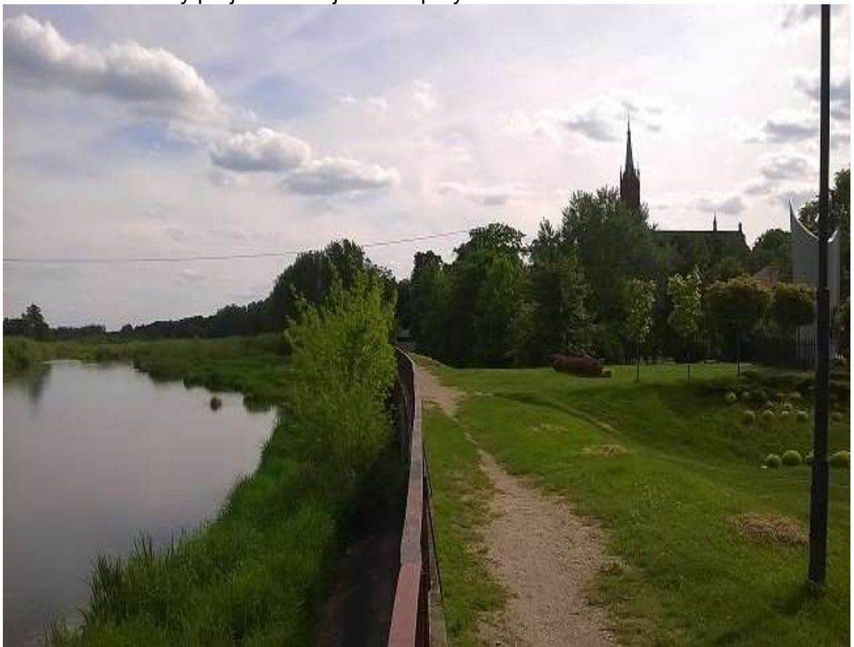
Widok 16 – Tereny projektowanej kładki i przystani