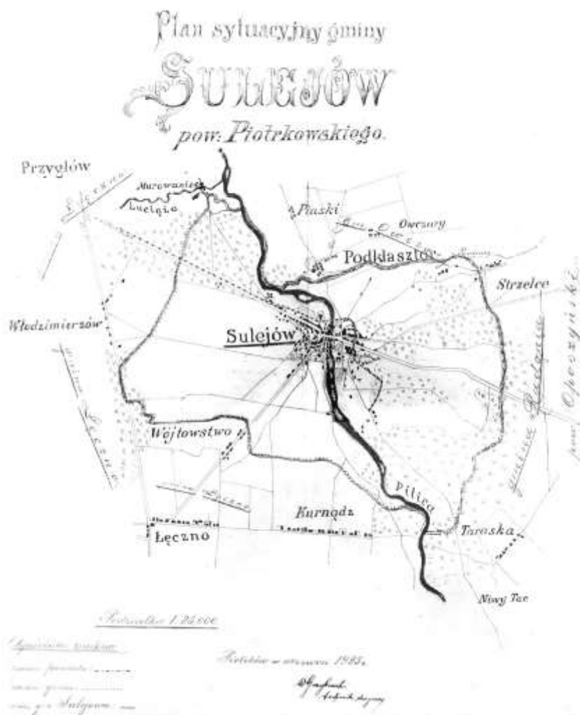
Plan gminy Sulejów z 1925r.