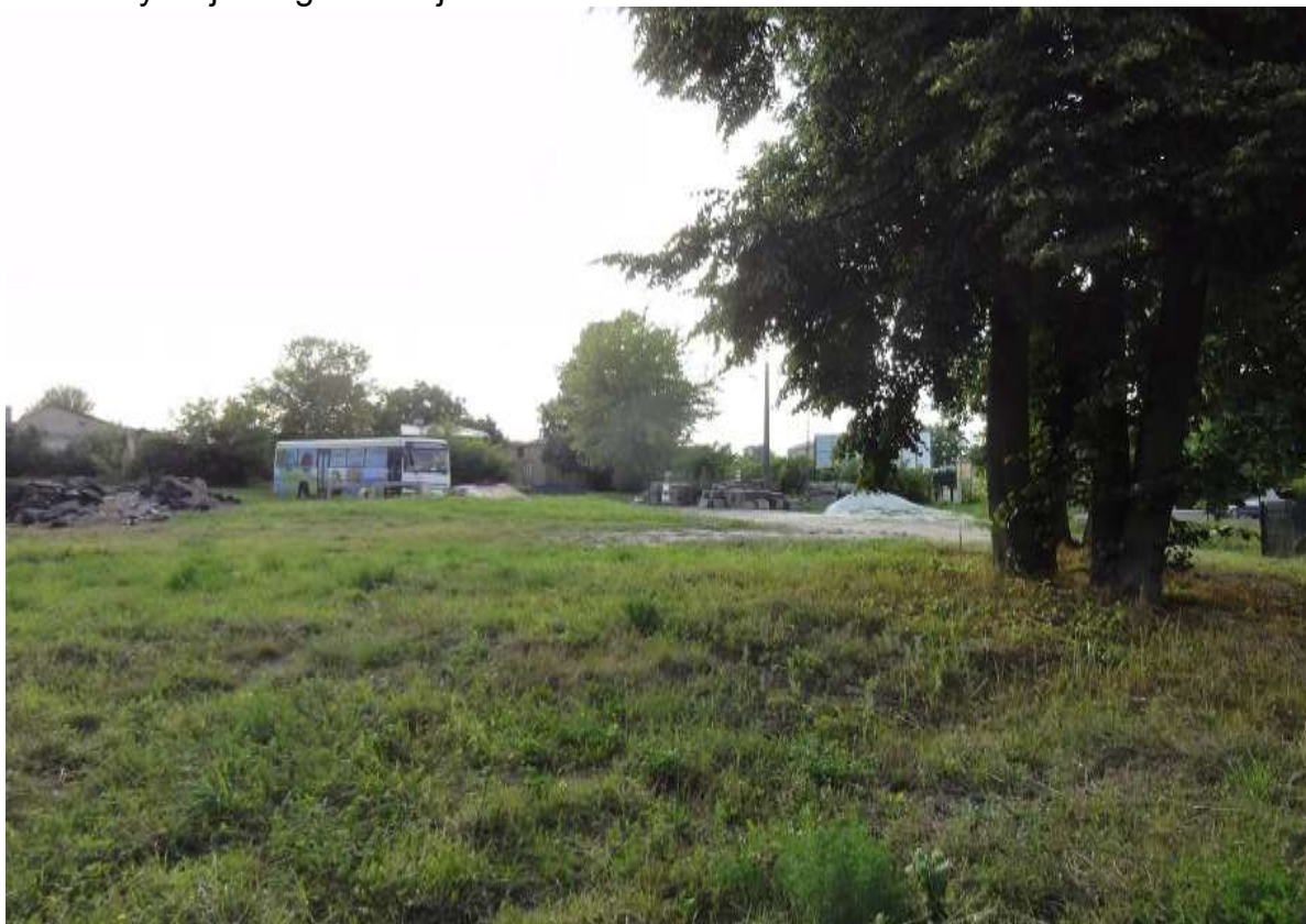
Widok 1 – Ugór miejski przy ul. Szkolnej

Lokalizacja widoków zgodnie z rys. 001 „Lokalizacja terenów opracowania, widoki inwentaryzacji fotograficznej”