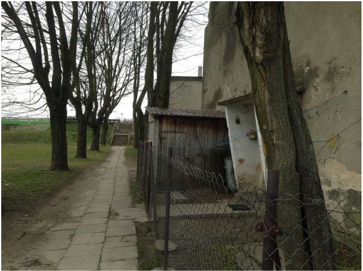
Widok 21 – Stary Rynek