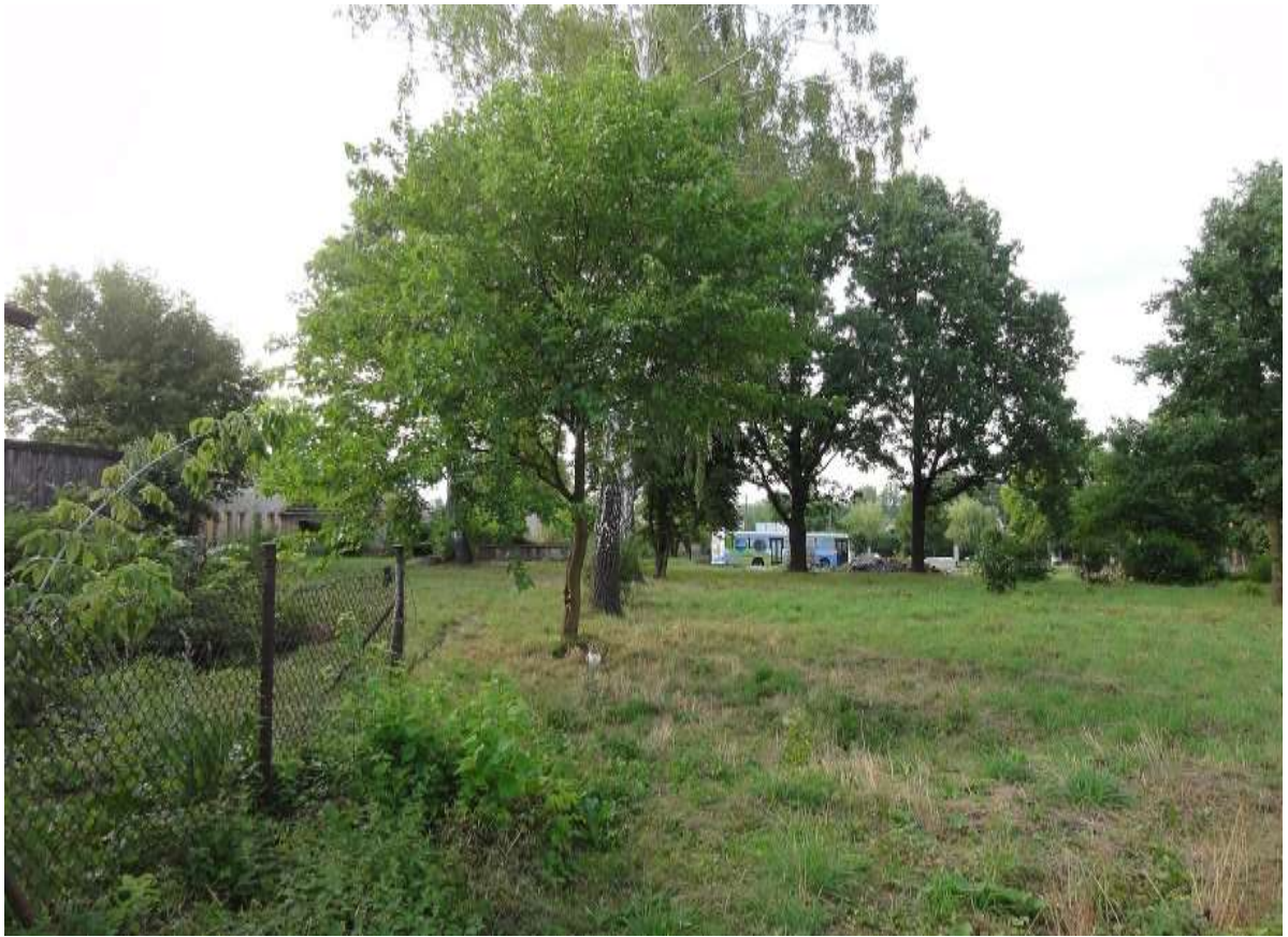
Widok 5 – Ugór miejski przy ul. Szkolnej