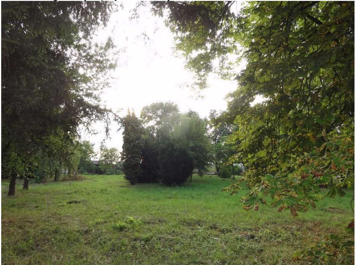
Widok 4 – Ugór miejski przy ul. Szkolnej