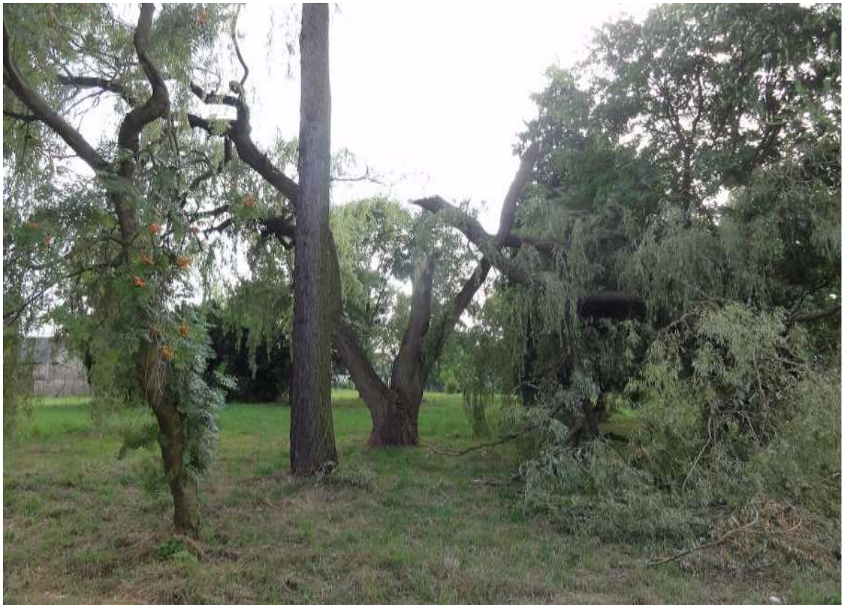
Widok 3 – Ugór miejski przy ul. Szkolnej