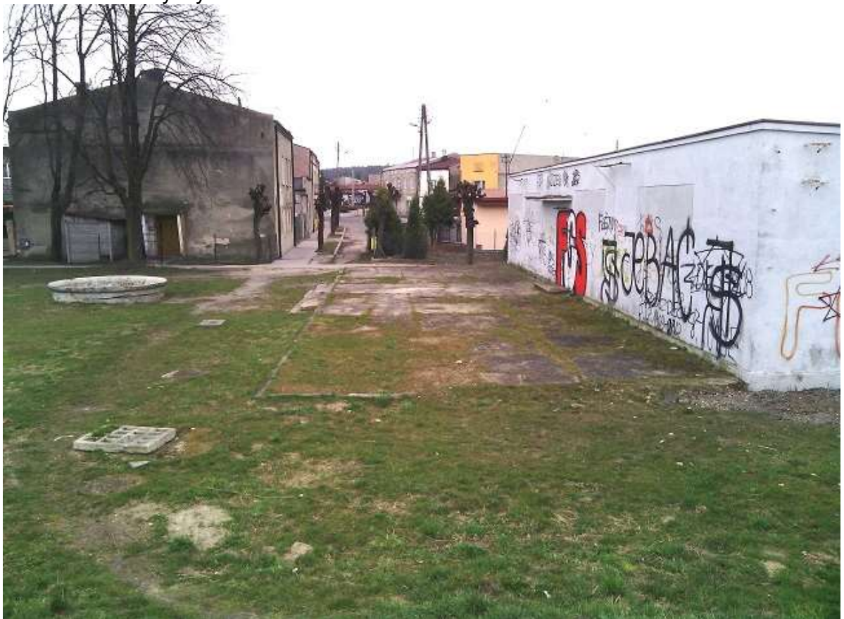
Widok 22 – Stary Rynek