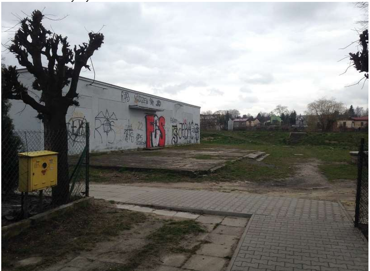
Widok 20 – Stary Rynek