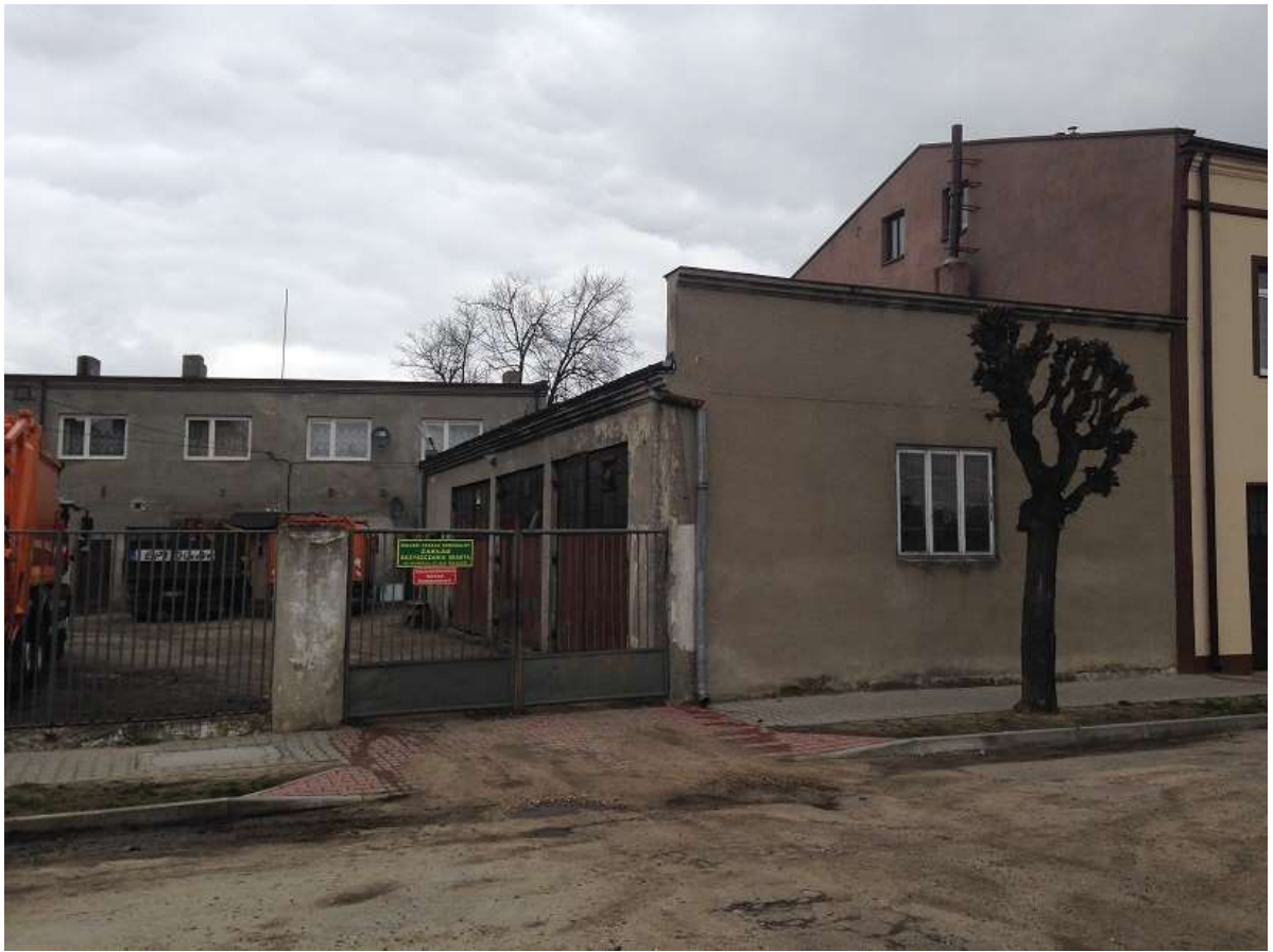
Widok 19 – Stary Rynek