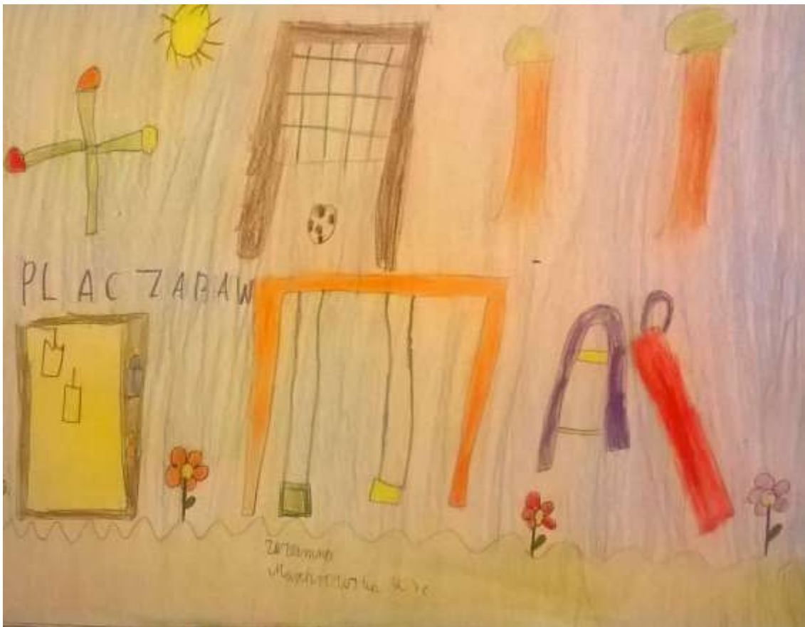
Praca Zuzanny z klasy IIIc