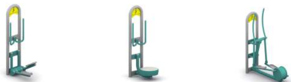
Elementy siłowni zewnętrznej

Z uwagi na powyższe wytyczne projektuje się nawierzchnie z piasku zajmowaną przez urządzenia zabawowe wraz ze strefą bezpieczeństwa do każdego z nich. Grubość nawierzchni wynosi 30 cm w celu zabezpieczenia ewentualnych upadków. Dla urządzeń siłowych zastosowano wspólną połączoną strefę bezpieczeństwa o