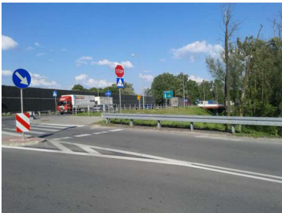
Droga krajowa nr 12

Każde gospodarstwo w Przyglowie korzysta z sieci elektrycznej i wodociągowej. Miejscowość jest również wyposażona w infrastrukturę telekomunikacyjną. Układ odzwierciedla przebiegające ciągi komunikacyjne. Zabudowa dość zwarta, biegnąca wzdłuż dróg przebiegających przez miejscowość z kilkoma wyjątkami, niemal w całości współczesna.