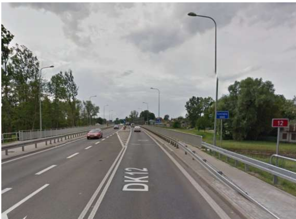
Most na rzece Luciąży