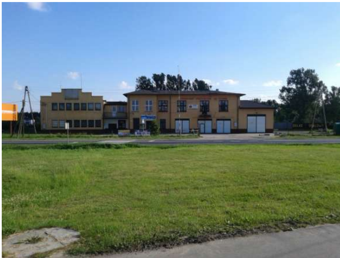
Budynek Ochotniczej Straży Pożarnej