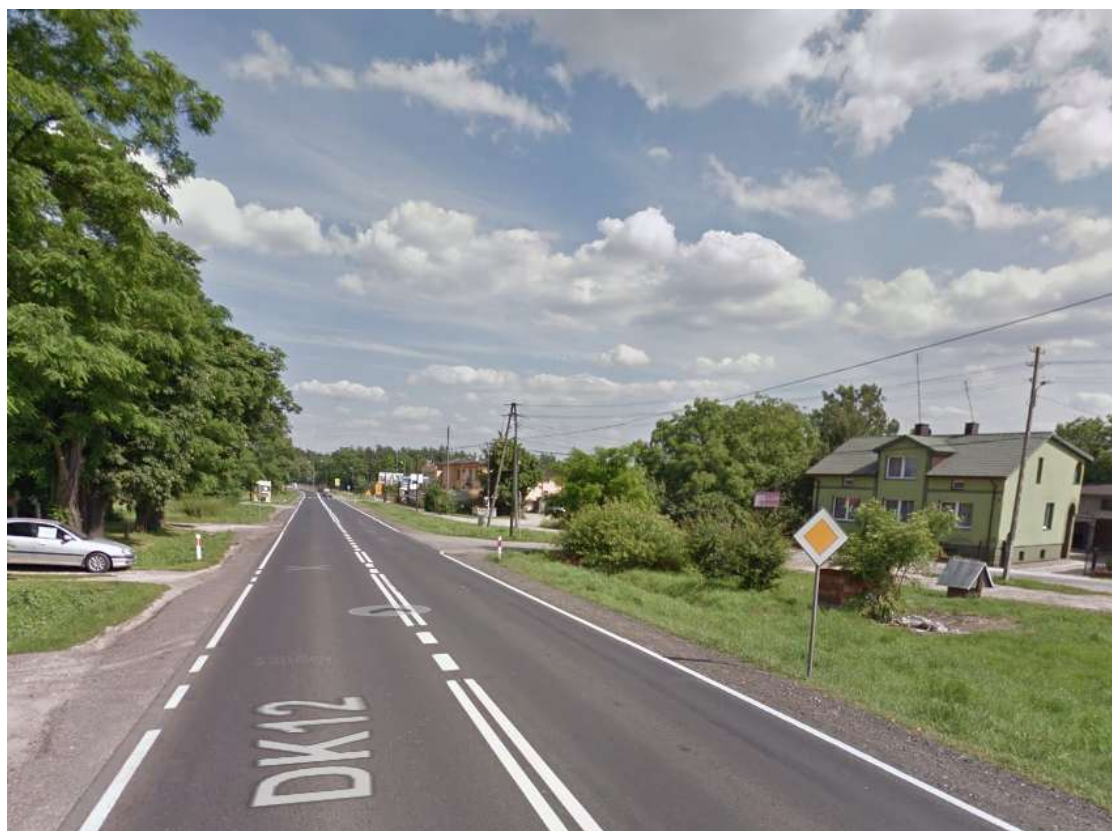
Wjazd do miejscowości od strony Piotrkowa Trybunalskiego