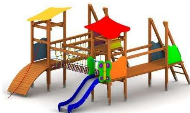
Przykładowa wizualizacja placu zabaw