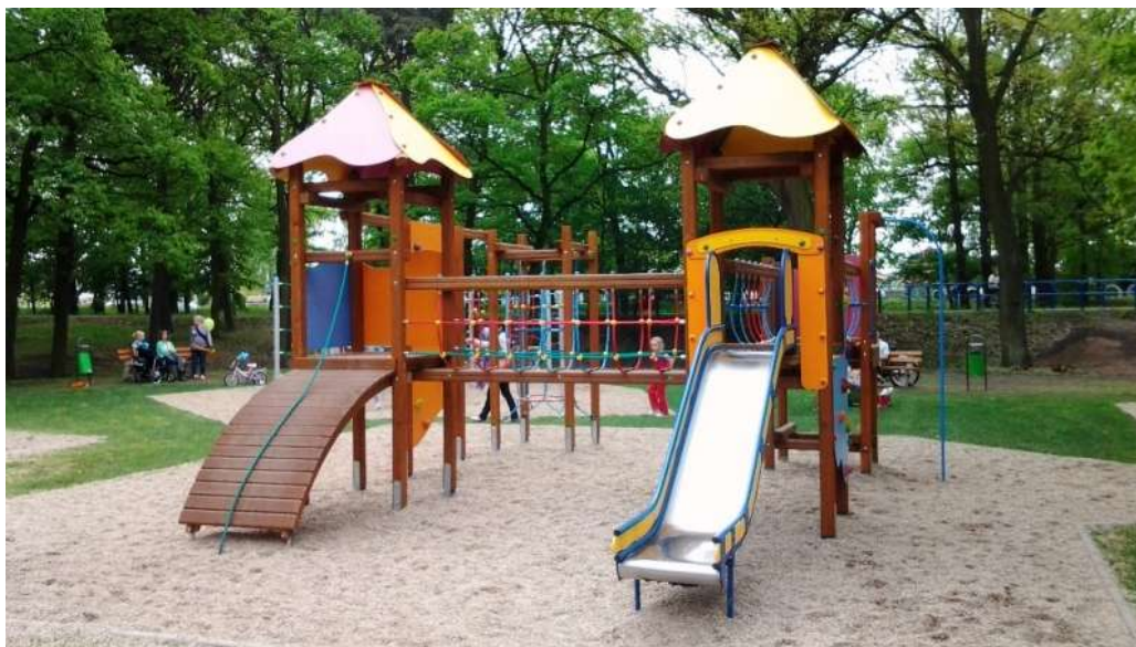
Przykładowy plac zabaw

wymiarach 10,8 x 4,5 m z uwagi na ich sąsiedztwo. Strefę tą należy wykonać ze żwiru (ziarno od 2 do 8 mm) o gr. 30 cm. Obrzeża stref bezpieczeństwa wykonać z betonowych krawężników z elastyczną nakładką.