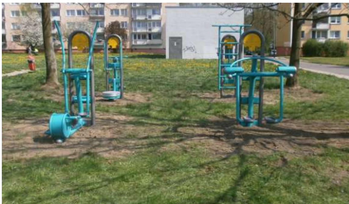
Przykładowy zestaw siłowni zewnętrznej

2. Uporządkowanie przestrzeni w centrum miejscowości i zagospodarowanie placu na park;