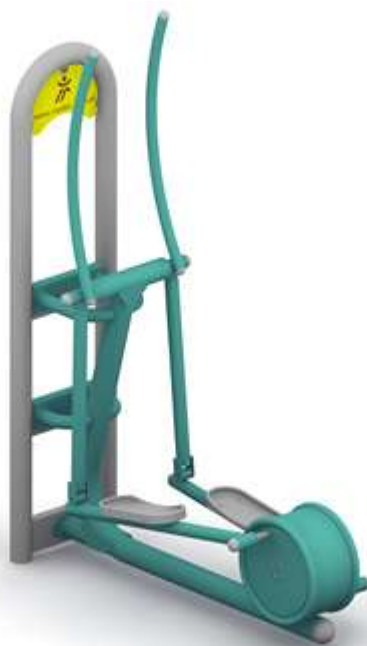
Przykład elementu siłowni zewnętrznej – narciarz biegowy