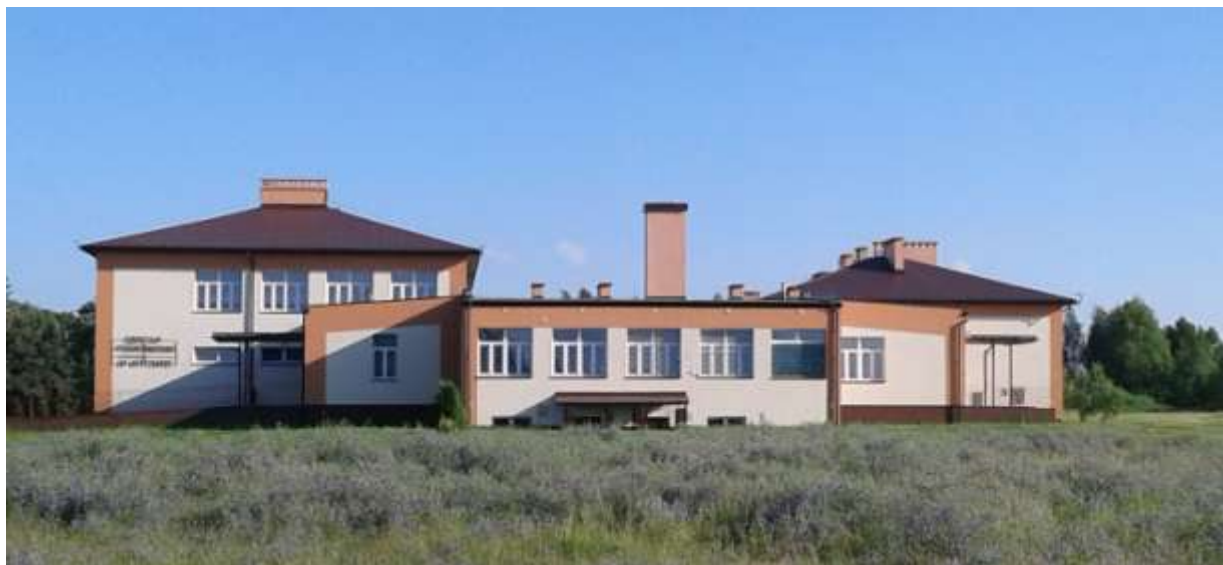
Budynek Szkoły Podstawowej