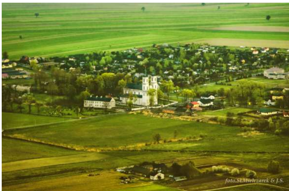
Zdjęcie przedstawia miejscowość oraz Kościół św. Małgorzaty i św. Augustyna