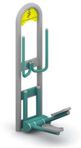
Przykład elementu siłowni zewnętrznej – biegacz