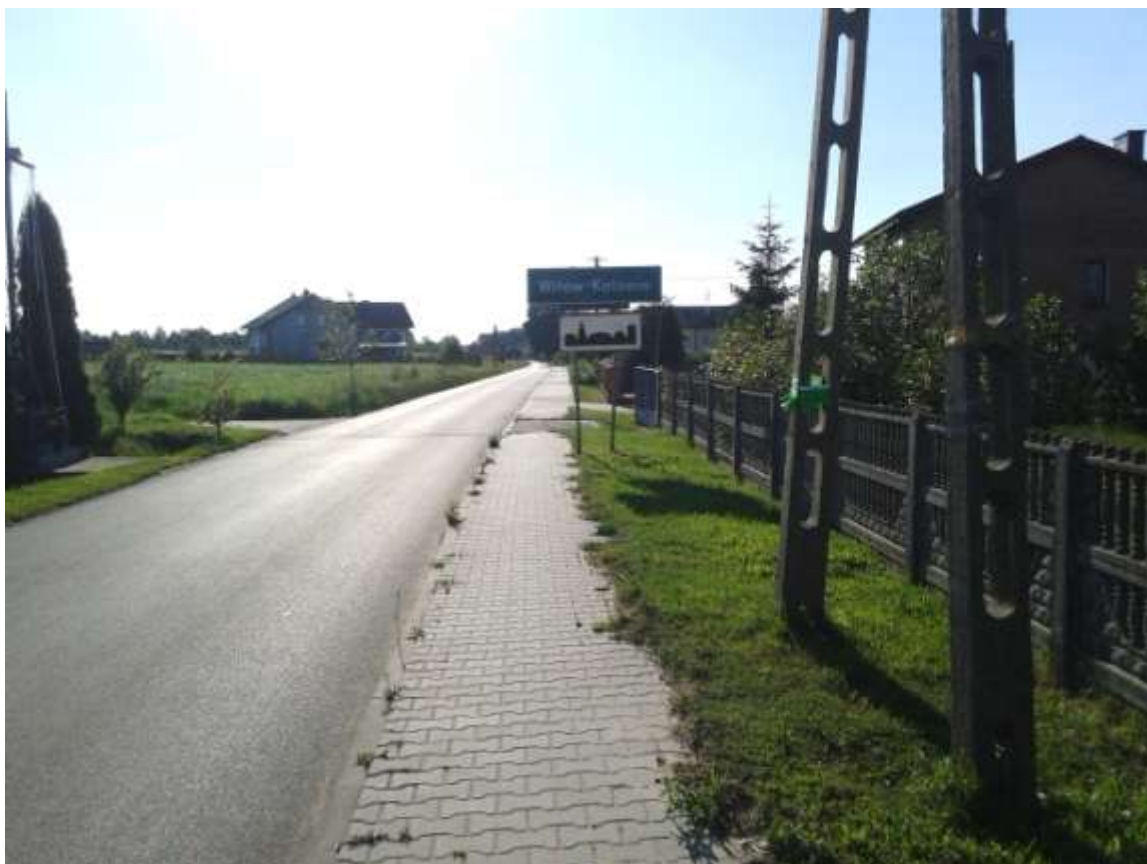
Wjazd do miejscowości od strony miejscowości Kałek

Każde gospodarstwo w Witów – Kolonia korzysta z sieci elektrycznej i wodociągowej. Miejscowość jest również wyposażona w infrastrukturę telekomunikacyjną. Układ odzwierciedla przebiegające ciągi komunikacyjne. Zabudowa dość zwarta, biegnąca wzdłuż dróg przebiegających przez miejscowość z kilkoma wyjątkami, niemal w całości współczesna.