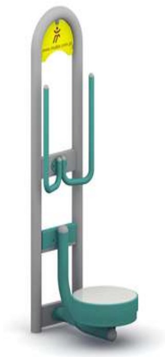
Przykład elementu siłowni zewnętrznej – twister