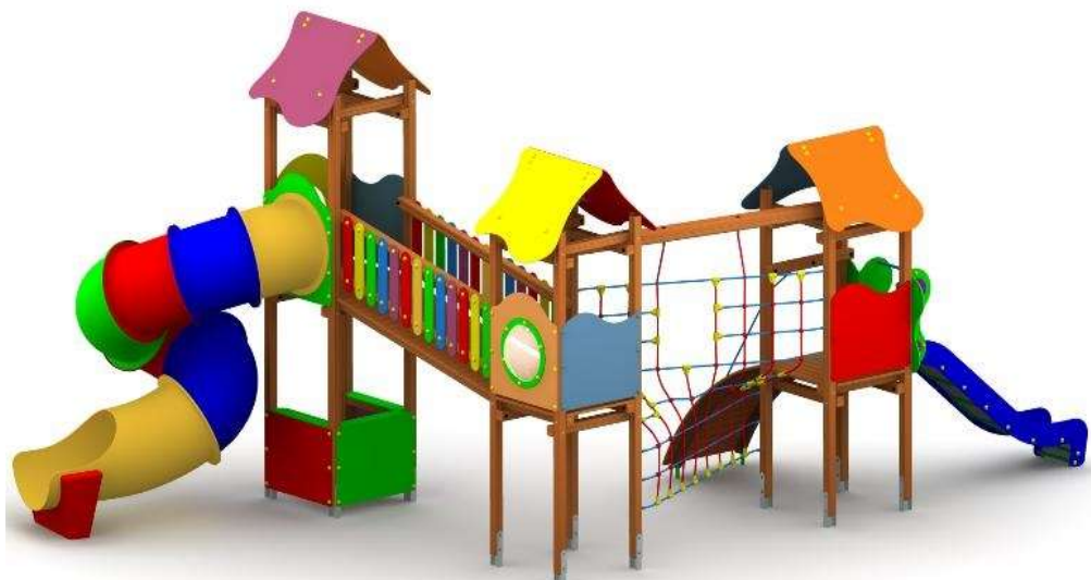
Przykład zestawu zabawowego