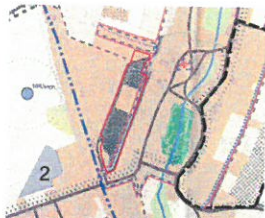
WYRYS ZE STUDIUM UWARUNKOWAŃ I KIERUNKÓW ZAGOSPODAROWANIA PRZESTRZENNEGO MIASTA SKÓRCZ skala 1 : 10 000