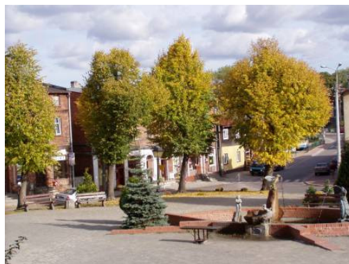
Rys. 7. Rynek Maślany

Miejszem spotkań mieszkańców, chętnie odwiedzanym przez turystów jest Rynek Maślany z fontanną i ławeczkami, wokół którego trwają jeszcze prace remontowe.