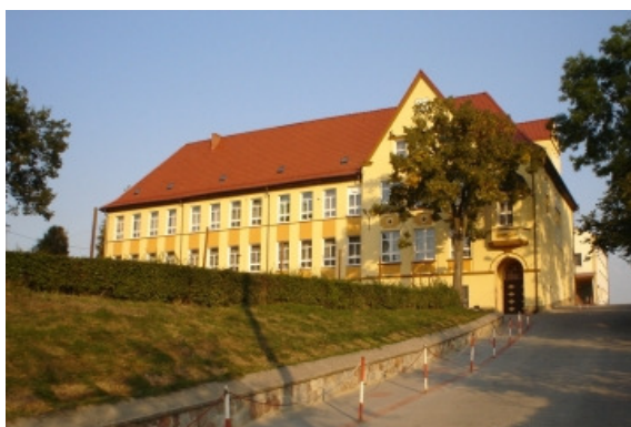
Rys. 8. Zespół Szkół Publicznych

elewacją oraz pięknie zagospodarowanym otoczeniem. Konieczna jest jednak dalsza jego rozbudowa i modernizacja, a przede wszystkim budowa pełnowymiarowej sali widowiskowo-sportowej i parkingu (zadaszonego) dla rowerów oraz modernizacja bloku żywieniowego. Dla poprawy bezpieczeństwa uczniów niezbędne jest wybudowanie zatoczki autobusowej przy szkole (w ul. Hallera) oraz utwardzenie ścieżek pieszych prowadzących do szkoły, zwyczajowo wykorzystywanych przez uczniów mieszkających przy ul. Wysokiej i na Osiedlu Młodych. Remontu wymagają trybuny oraz ogrodzenie wokół boiska dolnego.