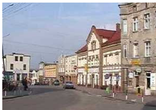
Rys. 4. Zabytkowe kamienice przy ul. Sobieskiego

Większość obiektów dziedzictwa kulturowego jest w złym stanie technicznym. Wyjątkiem, a zarazem wizytówką miasta, jest doskonale zadbane budynki kościoła (w świątyni prowadzone są liczne prace konserwatorskie) i jego otoczenie. Zaciekawienie i radość mieszkańców budzi trwająca od miesięcy rewitalizacja dawnego młyna w centrum miasta. Zabytkowe kamienice wymagają remontu, a szczególnie odnowienia elewacji zewnętrznych. Widoczne są jednak starania części właścicieli o poprawienie stanu technicznego i estetycznego budynków. Przywrócenie kamienic do dawnej świetności wymaga dużych nakładów finansowych, dlatego też ich właściciele oczekują wsparcia np. w postaci kredytów preferencyjnych. W najgorszym stanie technicznym są budowle stanowiące mienie PKP. Dawna lokomotywnia jest kompletnie zdewastowana, nadaje się tylko do rozbiórki, stanowi bowiem zagrożenie dla odwiedzających ją nastolatków. W nieco lepszym stanie znajduje się wieża ciśnień, którą po wykupieniu i remoncie można