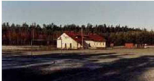
Rys. 6. Stadion Miejski

i skoku w dal oraz rzutu oszczepem, bieżnia szlakowa 400m, korty tenisowe, boisko do siatkówki plażowej, zaplecze szatniowo-sanitarne, salka konferencyjna)