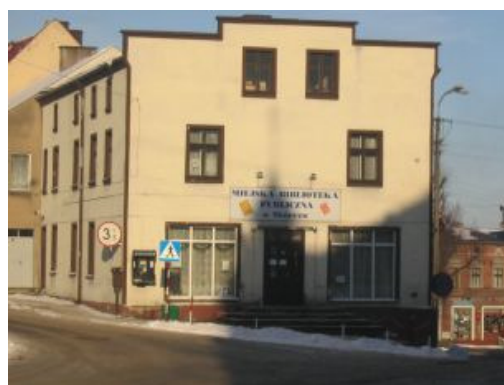
Rys. 11. Powiatowa i Miejska Biblioteka Publiczna

Działalność obu placówek ma dla mieszkańców duże znaczenie. Konieczne jest jednak poszerzenie form działalności, kręgu odbiorców, skoordynowanie działań z placówkami oświatowymi, a przede wszystkim odpowiednia promocja własnej działalności, a tym samym promocja Skórcza. Co prawda, na stronach internetowych Skórcza oraz w prasie w miarę systematycznie pojawiają się sprawozdania z odbytych imprez (wraz z dokumentacją fotograficzną), jednak wielu mieszkańcom naszego miasteczka brakuje wcześniejszej informacji o planowanych działaniach. Nie jest też dostępny aktualny kalendarz imprez kulturalnych (np. w Internecie).