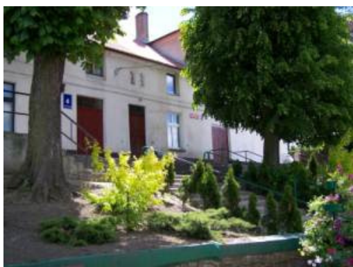
Rys. 10. Miejski Ośrodek Kultury

Powiatowa i Miejska Biblioteka jest skomputeryzowana. Oprócz tradycyjnych form udostępniania księgozbioru, prowadzi także wypożyczalnię książki mówionej. Biblioteka jest również organizatorem życia kulturalnego w mieście. Odbywają się w niej m.in. wieczory poezji, promujące twórczość miejscowych twórców, cykliczne spotkania pn. „Babski Wieczór”, kurs komputerowy dla seniorów oraz kurs języka angielskiego „Kociewiaczy zapraszają turystów po angielsku” organizowany we współpracy ze Stowarzyszeniem Kobiety - Kwiaty Kociewia. Znajduje się w niej również punkt informacji turystycznej oraz punkt sprzedaży książek o regionie, brak jest jednak odpowiedniej tablicy informacyjnej. Wnętrze budynku biblioteki jest sukcesywnie modernizowane, odnowienia wymaga zniszczona elewacja.