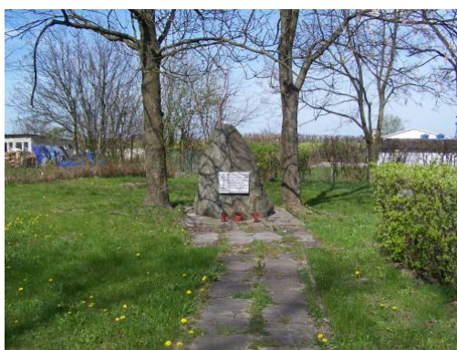
Rys. 5. Obelisk przy ul. Pomorskiej