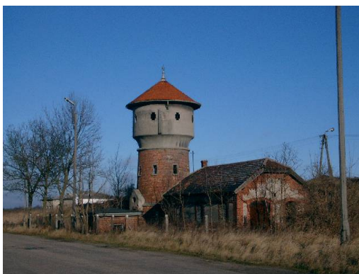
Rys. 3. Wieża ciśnień