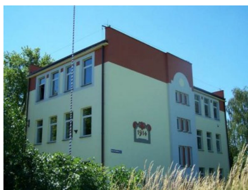
Rys. 9. Zespół Szkół Ponadgimnazjalnych

Ważnym ogniwem w procesie edukacji jest również placówka wychowania przedszkolnego. Dzieci mają zapewnioną opiekę logopedyczną, a za dodatkową opłatą mogą uczestniczyć w zajęciach języka angielskiego oraz rytmice. Baza przedszkolna jest zdecydowanie niewystarczająca i w złym stanie technicznym. Brak jest odpowiedniego zaplecza oraz bezpiecznego i nowoczesnie urządzonego placu zabaw. Budynek ma zniszczoną elewację.