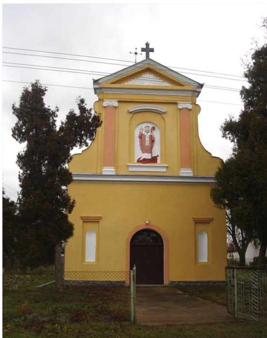
Kaplica Św. Wojciecha w Nebrowie Wielkim

Kościół Parafialny p.w. Matki Boskiej Królowej Polski w Nebrowie Wielkim