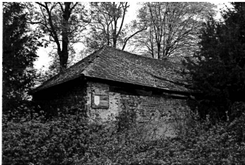
Fot. 2. Radoszyce, budynek "winiarni".

Pierwszy budynek pochodzący z przełomu XIX/XX w. to dawny budynek dworski. Drugi, drewniany o wydłużonej bryle, stanowił siedzibę dawnego nadleśnictwa. Najciekawszym obiektem jest zabytek ulokowany w obrębie parku, obok budynku nadleśnictwa, nazywany "piwnicą" lub "winiarnią". Murowany jest z cegły gotyckiej ze śladami rombowej dekoracji zendrówkowej. Jest budynkiem parterowym o wymiarach 6,5 x 10,75 m. Partia fundamentowa wykonana z kamieni eratycznych oraz łupanych piaskowców. W ścianie płd., w jej wsch. górnym odcinku zachował się szew po zamurowanym oknie, związanym z pierwszą fazą użytkowania budynku i zaślepionym po 1650 r. W dolnej partii środkowego odcinka tej ściany znaleziono ślad po innym zamurowanym okienku - prawdopodobnie małej szyi związanej z otworem oświetlającym niemieszkalne przyziemie. Inny charakter ma ściana wsch. murowana z wtórnie użytej cegły gotyckiej, cegły współczesnej oraz kamieni. Jest ona późniejsza i tworzy tymczasowe zamknięcie pierwotnego i znacznie dłuższego budynku. Do jego wnętrza wiedzie 5 ciosowych schodów, znajdują się tam dwie kolebkowo sklepione izby. Podczas badań stwierdzono, że budynek tzw. winiarni stanowi skrajną, zach. partię gotyckiego domu zamkowego, ciągnącego się dalej w kierunku wschodnim.