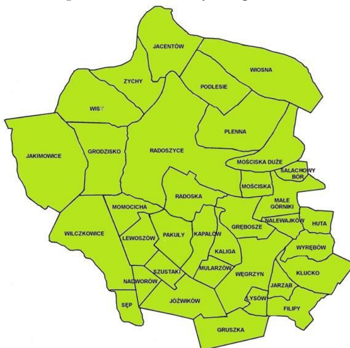
Mapa 1. Gmina Radoszyce w podziale na sołectwa.