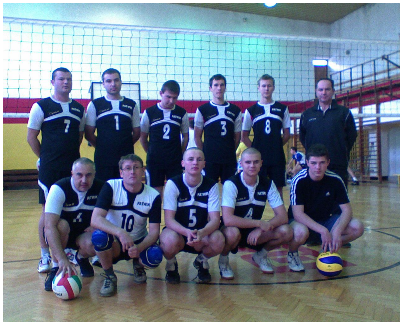
Sekcja piłki siatkowej

Główną dyscypliną sportową uprawianą w ramach LZS-u jest piłka nożna, jednak sporym zainteresowaniem cieszy się również piłka siatkowa. Od 2007 roku miłośnicy tej dyscypliny sportowej zaczęli grać amatorsko, jednak z biegiem czasu przyłączyli się do utworzonej w Stalowej Woli amatorskiej ligi piłki siatkowej.