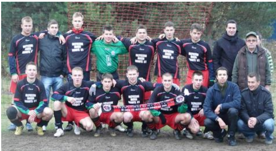
Drużyna piłki nożnej

Historia klubu wiąże się z datą 6 czerwca 2000 r., kiedy to Ludowy Zespół Sportowy Radomyśl został zarejestrowany w Sądzie Okręgowym w Tarnobrzegu. Kadra zespołu liczy 20 zawodników oraz 3 osoby wchodzące w sztab szkoleniowy.